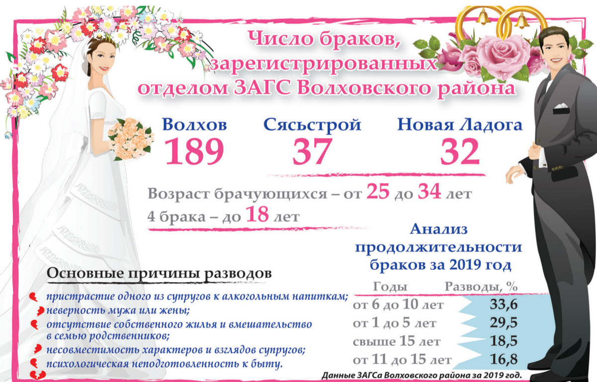
Иллюстрация: Михаила ГОРИНА