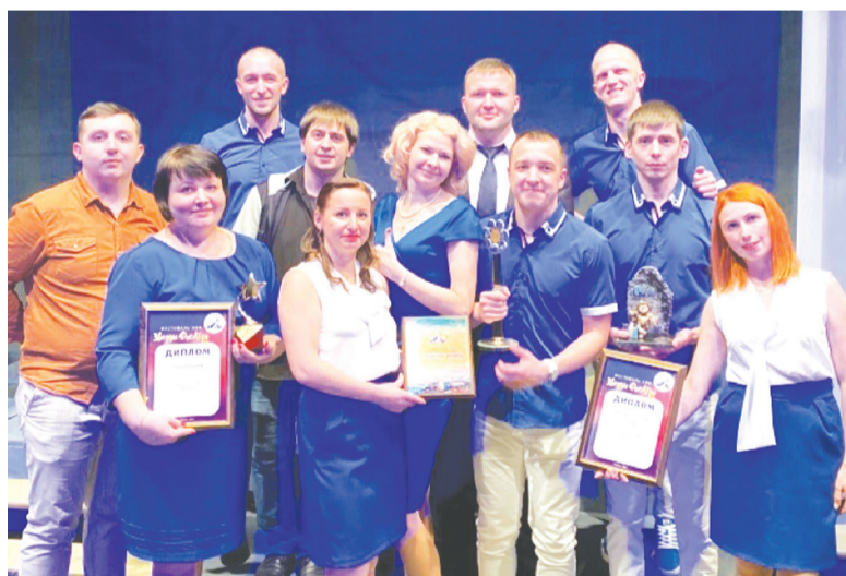
Волховская команда «На кураже!»