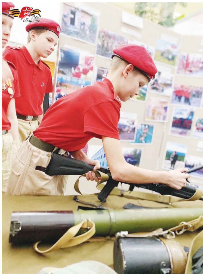
Материалы разворота подготовлены Волховским штабом «Юнармии»

В заключение фестиваля, подводя итоги презентаций, выставки, деловой игры и мастер-классов, организаторы назвали 10 отличившихся команд, среди которых команда «Юнармии». Все были отмечены дипломами и памятными подарками.