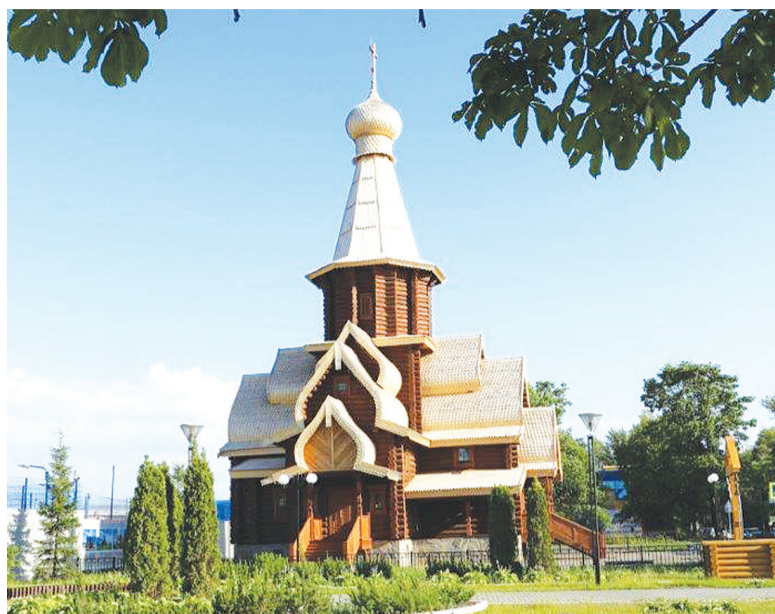
Храм Андрея Первозванного

Подготовлено пресс-службой ВФ АО «Апатит»