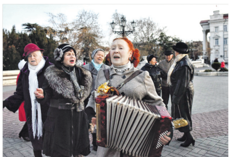
Севастополь, ноябрь 2014 года.

Лето 2014-го стало точкой отсчета и для тесных партнерских взаимоотношений между парламентариями Дона и Крыма. Было подписано соглашение о сотрудничестве между Законодательным Собранием Ростовской области и Госсоветом Республики Крым. Это помогло ускорить интеграцию полуострова в российское нормативно-правовое поле, ужесточить на полуострове парламентский контроль за исполнением законов. С рабочими поездками в Крым и в Красногвардейском районе побывали председатель Заксобрания области, руководители парламентских комитетов, депутаты. Методическую помощь донские депутаты оказали, например, в разработке и применении стандартов независимого бюджетного контроля. Также выяснилось, что прежде в законодательстве, действовавшем в Кры-