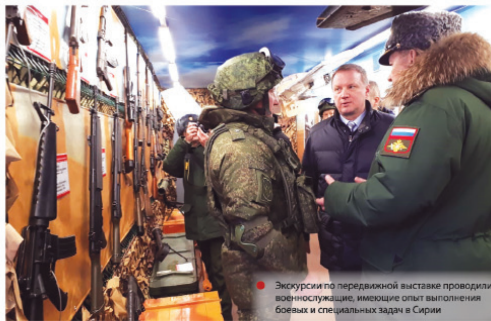
Экскурсии по передвижной выставке проводили военнослужащие, имеющие опыт выполнения боевых и специальных задач в Сирии

Холодное и огнестрельное оружие, самодельные взрывные устройства,