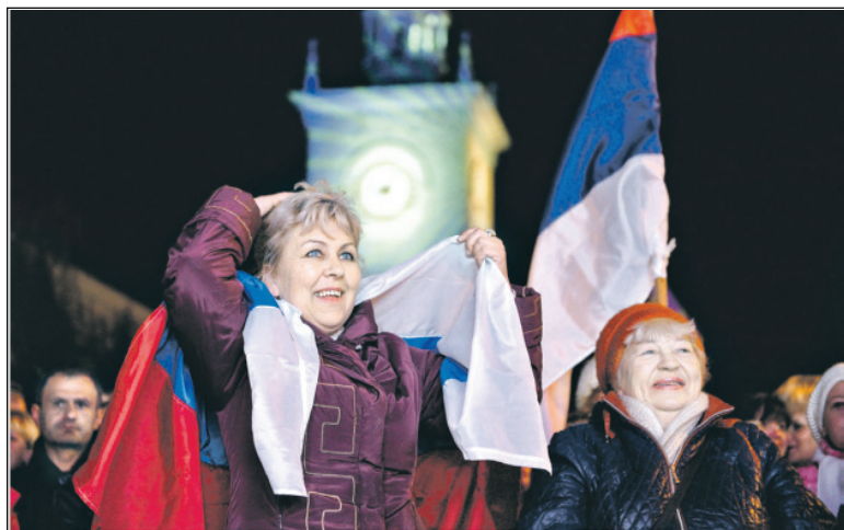
В Крыму празднуют переход на московское время.