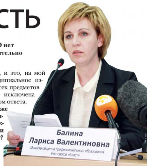
● Министр образования рассказала о новых требованиях к сдаче ЕГЭ

– Не могу сказать, чтобы принципиально. Требования для поступления в некоторые из них чуть выше, а в некоторые – такие же, как минимальный порог сдачи ЕГЭ. В этом году эти минимумы немного изменились по профильному уровню математики – вместо 20 баллов теперь нужно набрать 27, по иностранному языку – 22 вместо 20, и по обществознанию – 42 вместо 39