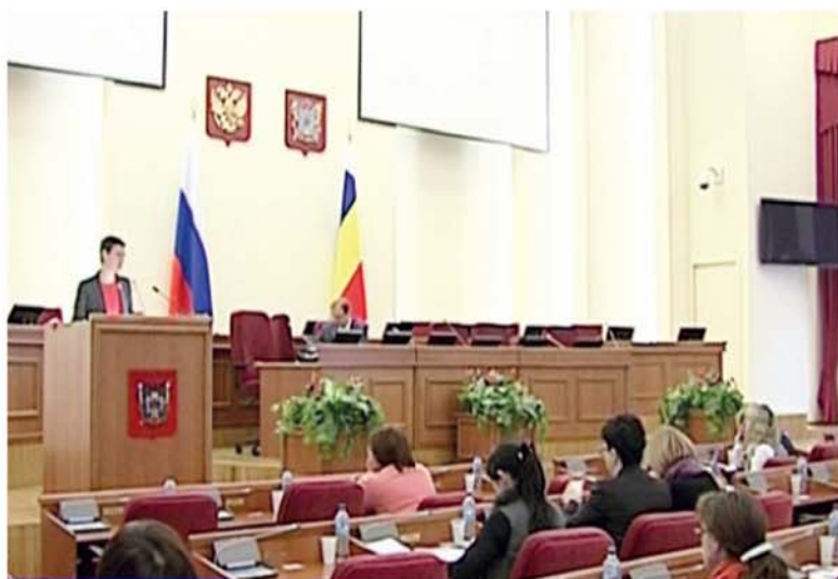
● Дни правового просвещения проходят второй год