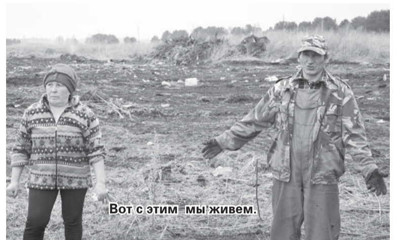
Вот с этим мы живем.

лею нашего посёлка. Также плитами уложена территория возле нового магазина «Лилия» по улице Лисина.