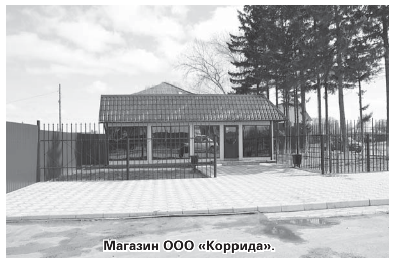
Магазин ООО «Коррида».