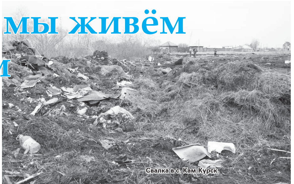
Свалка в с. Кам-Курск.