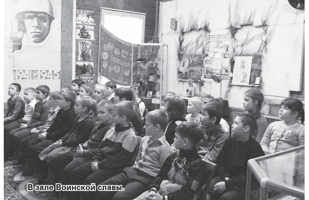
В зале Воинской славы.