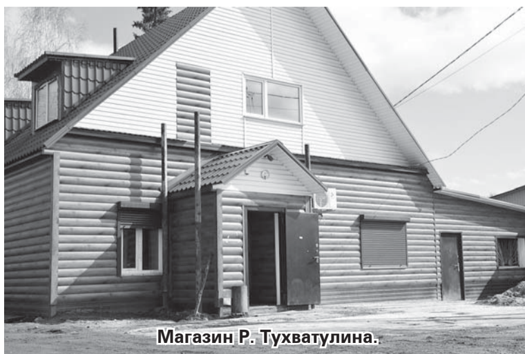
Магазин Р. Тухватулина.

Андрей ФРОЛОВ.