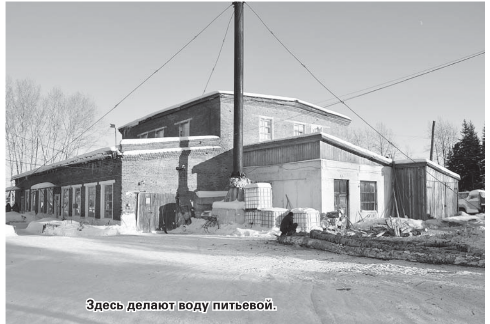
Здесь делают воду питьевой.

Приведу пример. Приняв водопроводные системы села Мыс, мы столкнулись с проблемой некачественной воды. После ряда мероприятий нам удалось найти скважину с чистой водой и запитать от неё всю водопроводную сеть, но так как построен он был в 70-е годы прошлого века, то за эти годы в нем накопилось много отложений. Для решения данной проблемы есть два варианта.