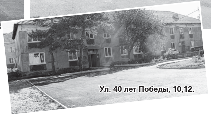
Ул. 40 лет Победы, 10,12.