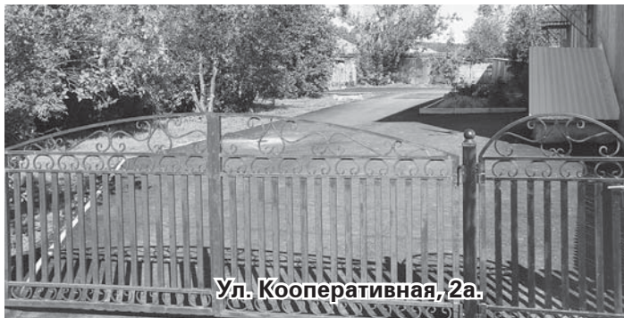
Ул. Кооперативная, 2а.

«Комиссия уже провела приемку на предмет