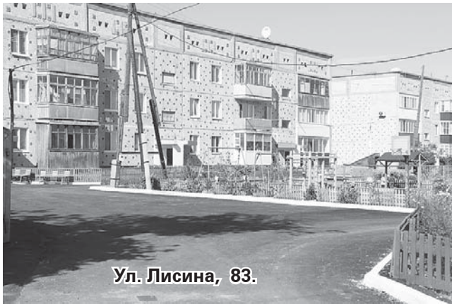
Ул. Лисина, 83.