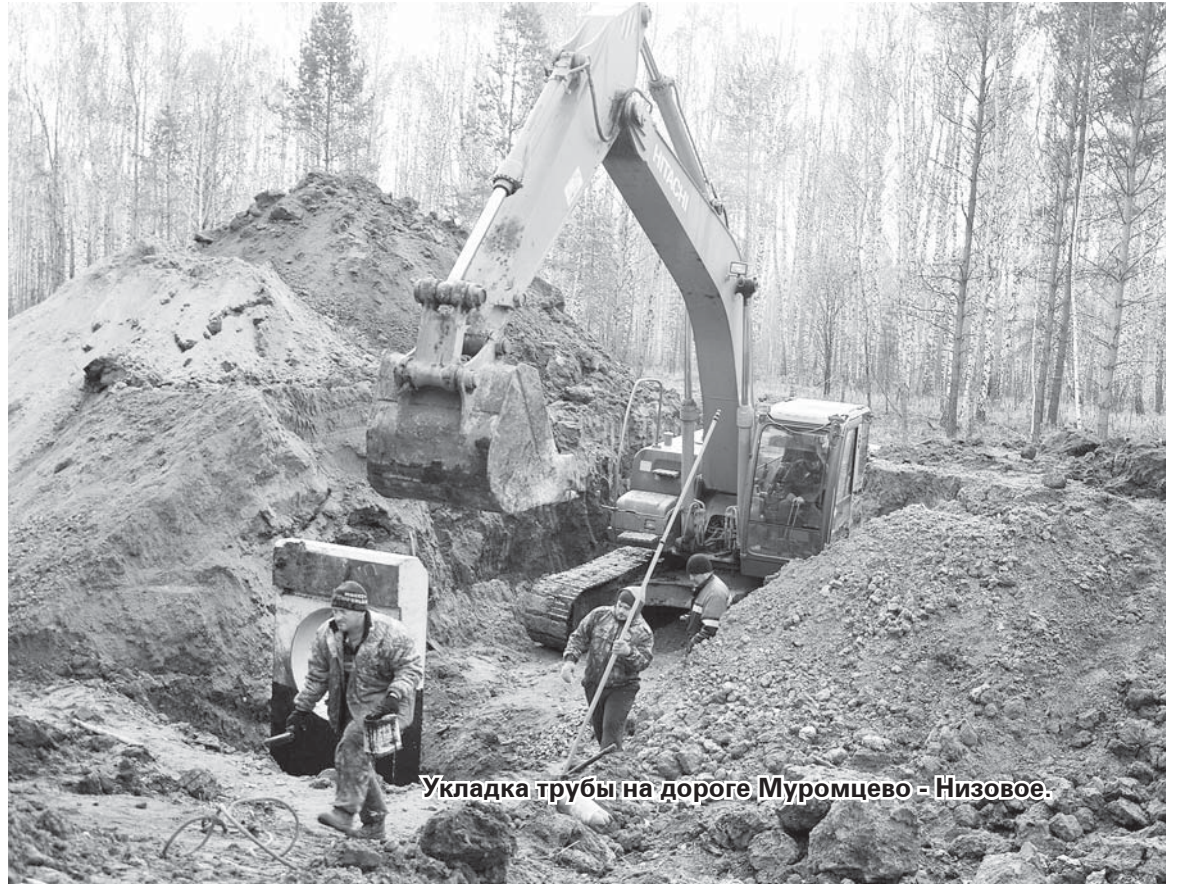
Укладка трубы на дороге Муромцево – Низовое.

В преддверии профессионального праздника мы не будем выделять кого-то отдельно – все старались, хорошо поработали. На данный момент коллектив полностью укомплектован, каждый добросовестно выполняет порученное ему дело. Развивается и обновляется материально-техническая база предприятия. Например, куплен КамАЗ с тралом, к нему 14-метровый