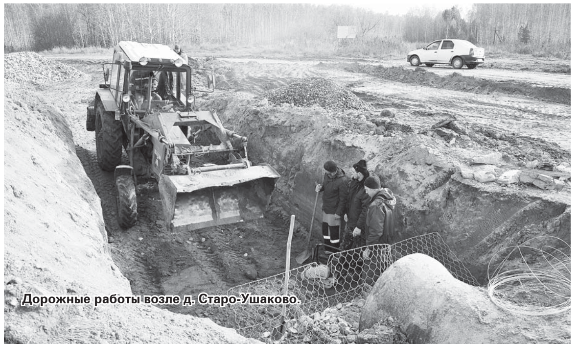
Дорожные работы возле д. Старо-Ушаково.