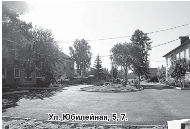
Ул. Юбилейная, 5, 7.