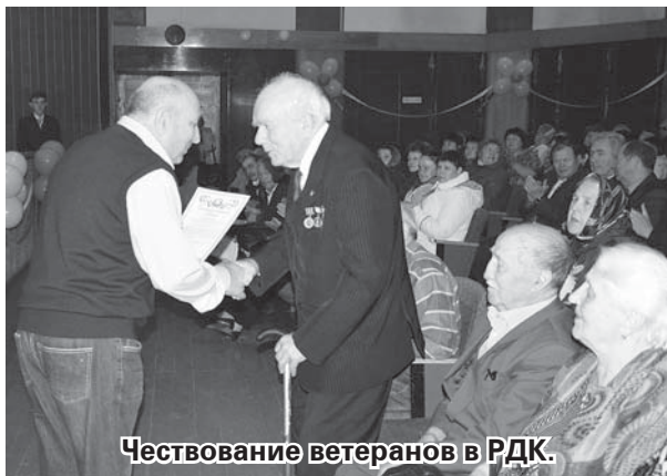
Чествование ветеранов в РДК.

29 сентября в нашем районе отмечалось 50-летие ветеранского движе-