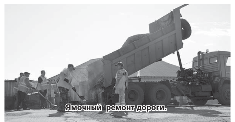
Ямочный ремонт дороги.