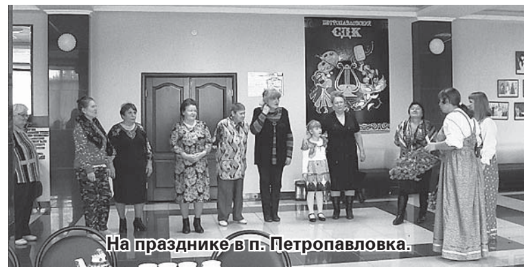
На празднике в п. Петропавловка.

Ну а мы в завершение обзора писем хотим отметить, что в нынешнюю субботу (14 октября) будет православный праздник – Покров день, в народной традиции знаменующий встречу осени с зимой. В первый праздник холода на Руси было принято печь блины – «запекать углы», чтобы из жи-