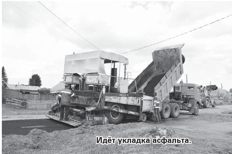
Идёт укладка асфальта.