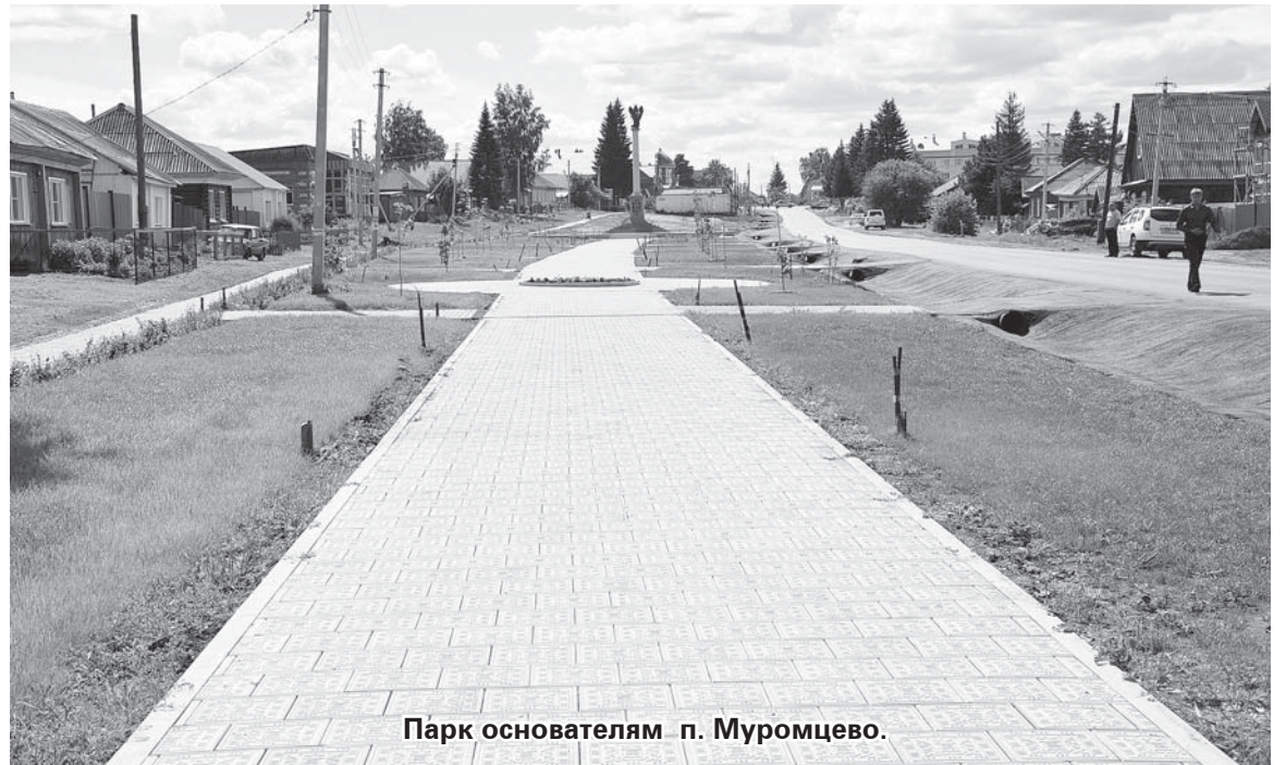
Парк основателям п. Муромцево.