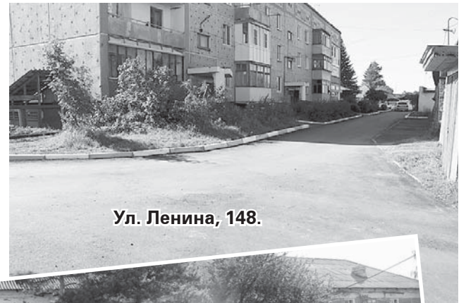
Ул. Ленина, 148.