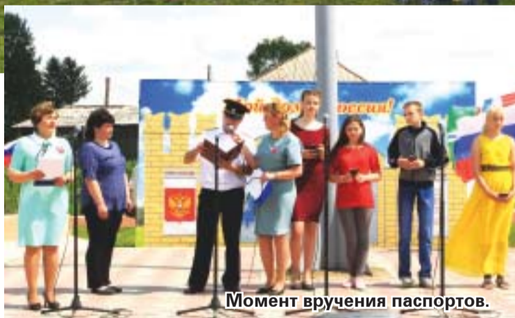
Момент вручения паспортов.