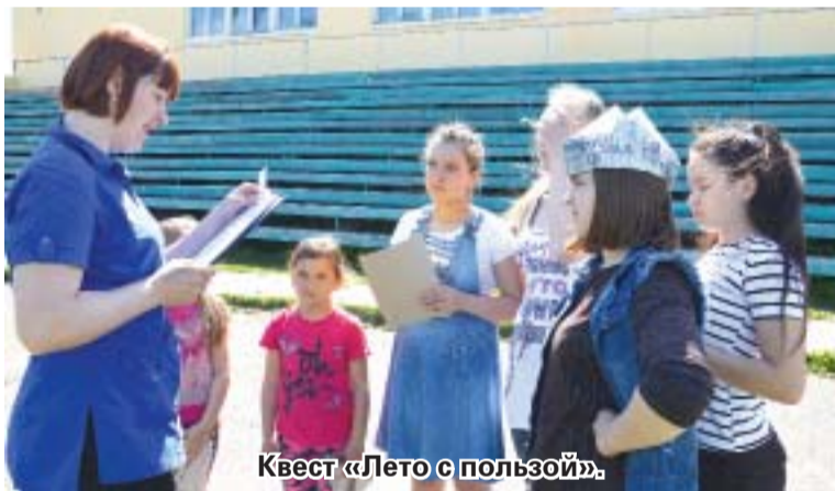
Квест «Лето с пользой».

Начался период самых длительных школьных каникул. Родители и педагоги стремятся организовать для детей отдых, не связанный с времяпрепровождением у компьютера и телевизора, чтобы их чада смогли за лето восстановить силы и здоровье. Для большинства прекрасным выбором становится лагерь дневного пребывания.