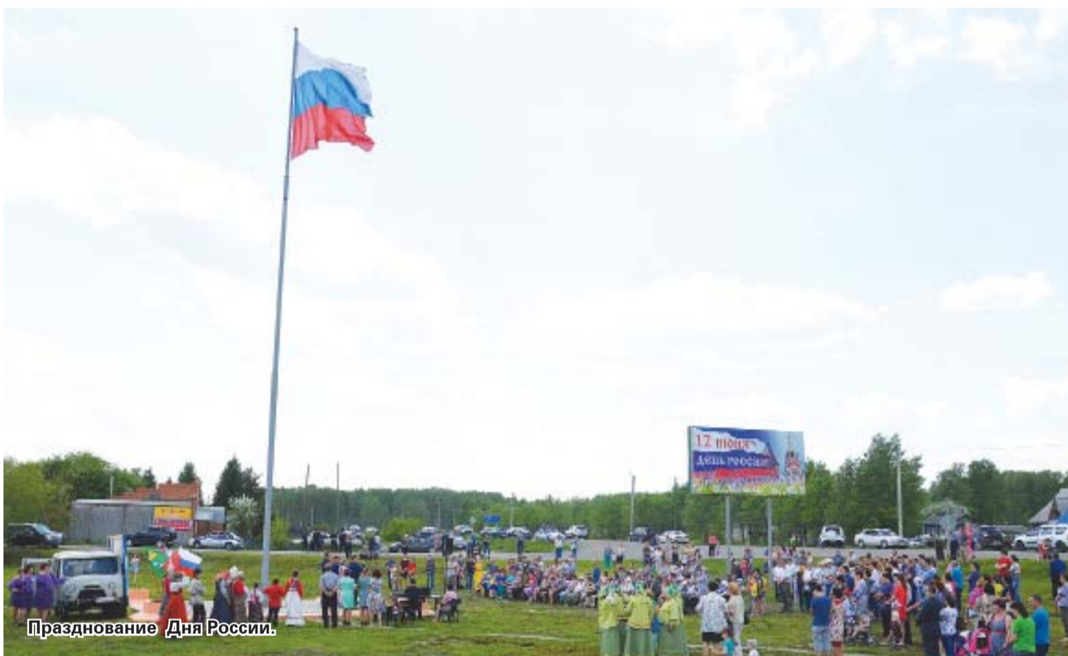
Празднование Дня России.