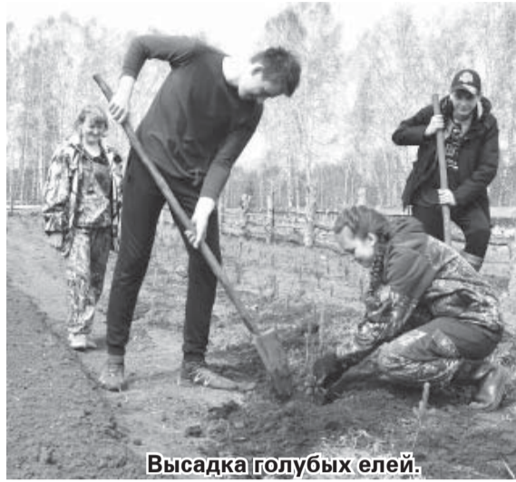
Высадка голубых елей.

Работа на территории древесной школы в своём роде