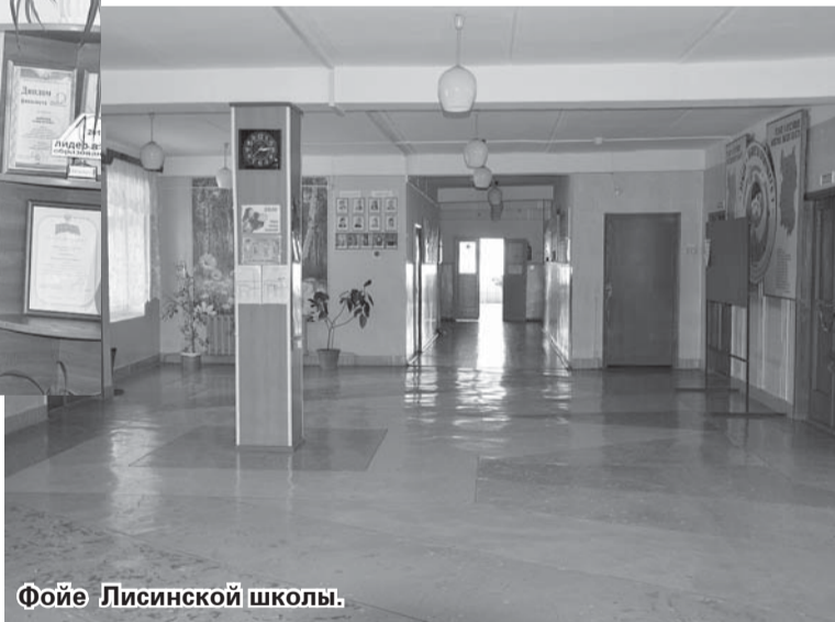
Фойе Лисинской школы.

Лисинская СОШ, которую мы посетили на прошлой неделе, встретила нас чистой и уютно, а также готовностью открыть двери для ребят. Территория школы также приведена в образцовый порядок. Несмотря на каникулы, на школьной площадке много подростков,