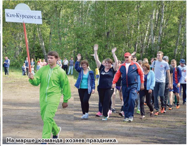
На марше команда хозяев праздника.