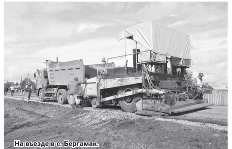
На въезде в с. Бергамак.