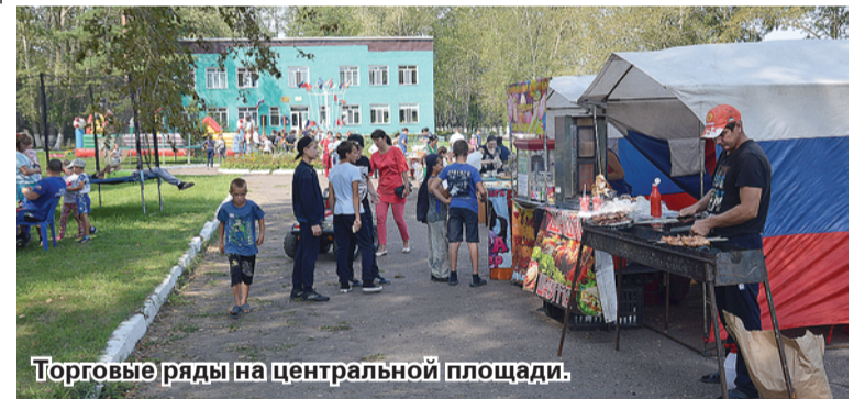
Торговые ряды на центральной площади.

бешено мчались к заветной черте, под восторженные крики болельщиков первым её пересёк муромцевский скакун.