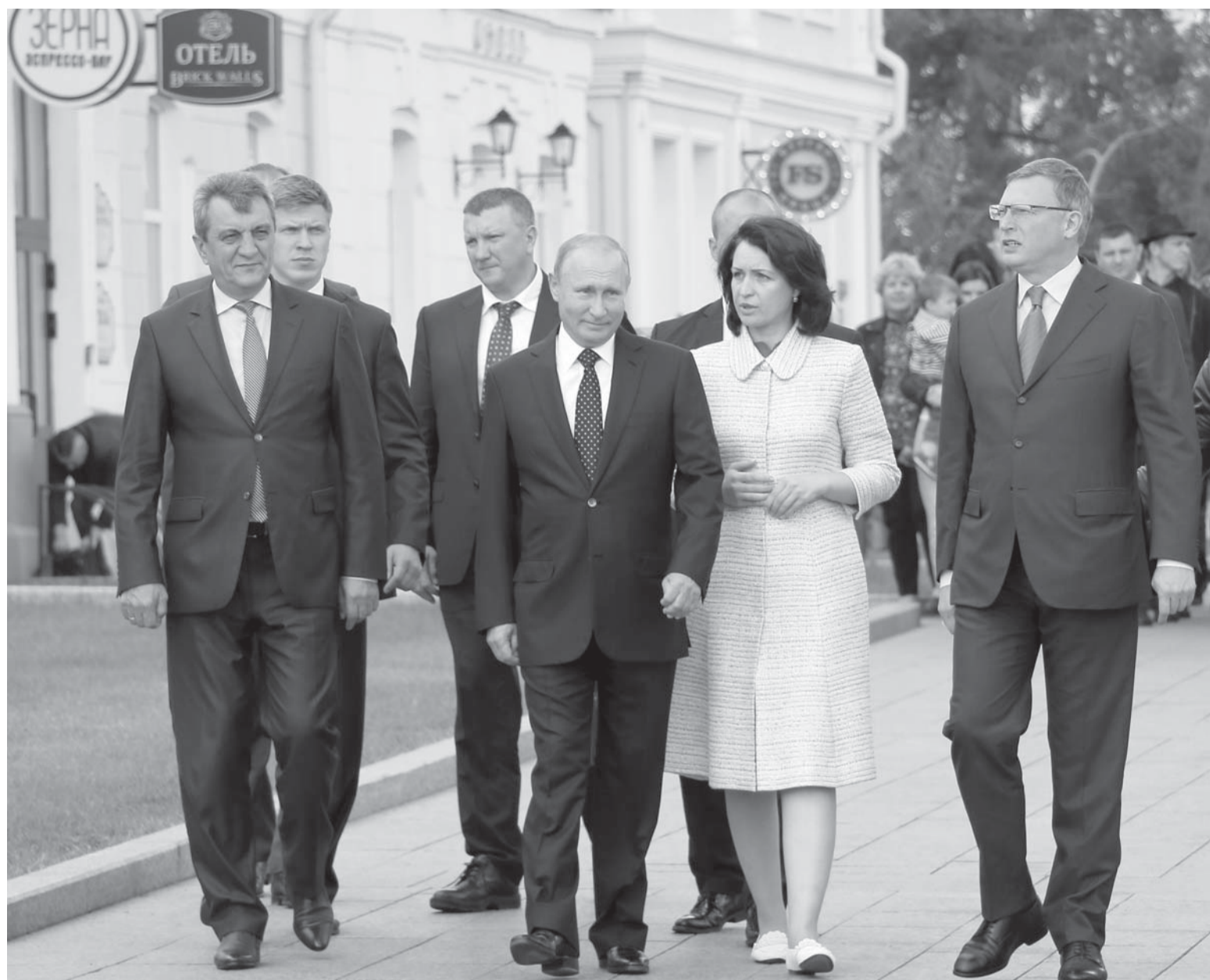
Владимир Путин в компании с Сергеем Меняйло (слева), Александром Бурковым и Оксаной Фадиной прогулялся по обновленному Любинскому проспекту.

– На начало года более трех тысяч квартир в Омске было не продано, поэтому мы соз-