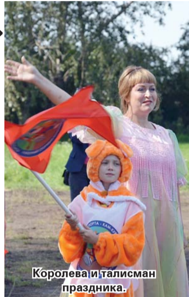
Королева и талисман праздника.

Одними из первых разыграли призовые места и награды участники конных скачек. На окраине села была подготовлена традиционная для таких соревнований дистанция. Шесть