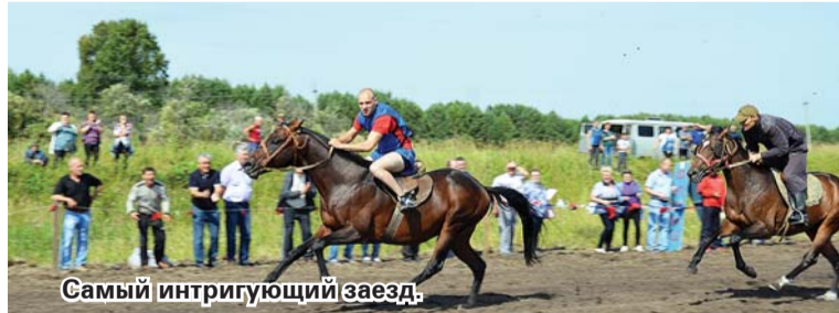
Самый интригующий заезд.

поселений выставили своих скакунов. Взору собравшихся зрителей на первом этапе было предложено посмотреть три предварительных забега. Победителями в них стали наездники из команд Муромцевского, Карбызинского, Мысовского поселений. Примерно через полчаса им было предложено разыграть призовые места. Сразу же после старта мысовский скакун вырвался вперёд и лидировал больше половины круга. На длинном и прямом участке дистанции муромчанин грамотно обошёл своего соперника и вырвался вперёд. Далее зрители долгое время гадали, сможет ли мысовчанин вернуть лидерство. Интрига сохранялась практически до финишного створа. И вот последний поворот... Кони