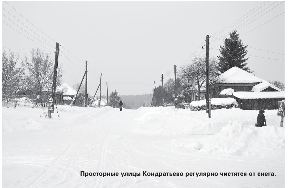
Просторные улицы Кондратьево регулярно чистятся от снега.

Что касается вопросов освещения улиц поселения, то, в отличие от райцентра, где оно