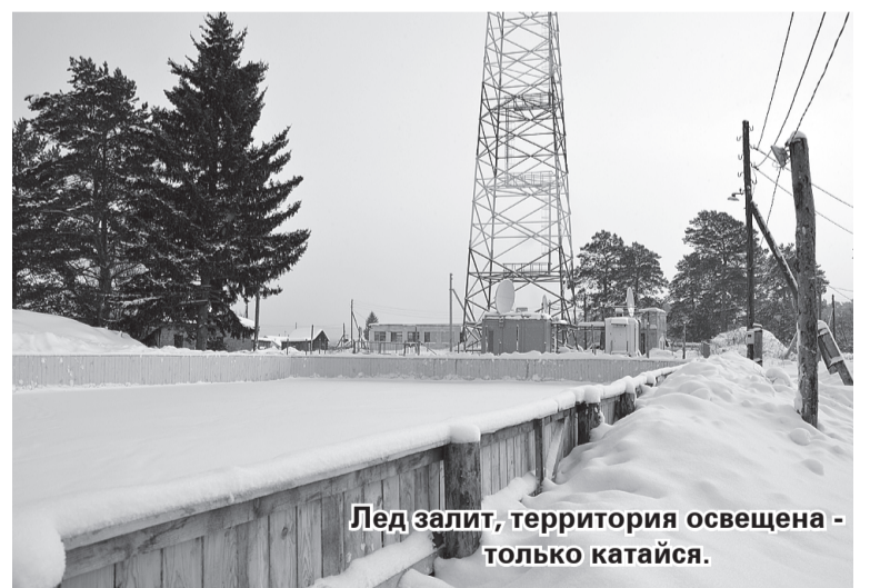
Лед залит, территория освещена - только кататься.

На данный момент лёд залит, освещён, площадка регулярно очищается от снега, на что отдельные затраты (всем этим соответственно занимается администрация сельского поселения), а вот кататься-то особо некому, кроме небольшого числа школьников. Основная проблема в том, что