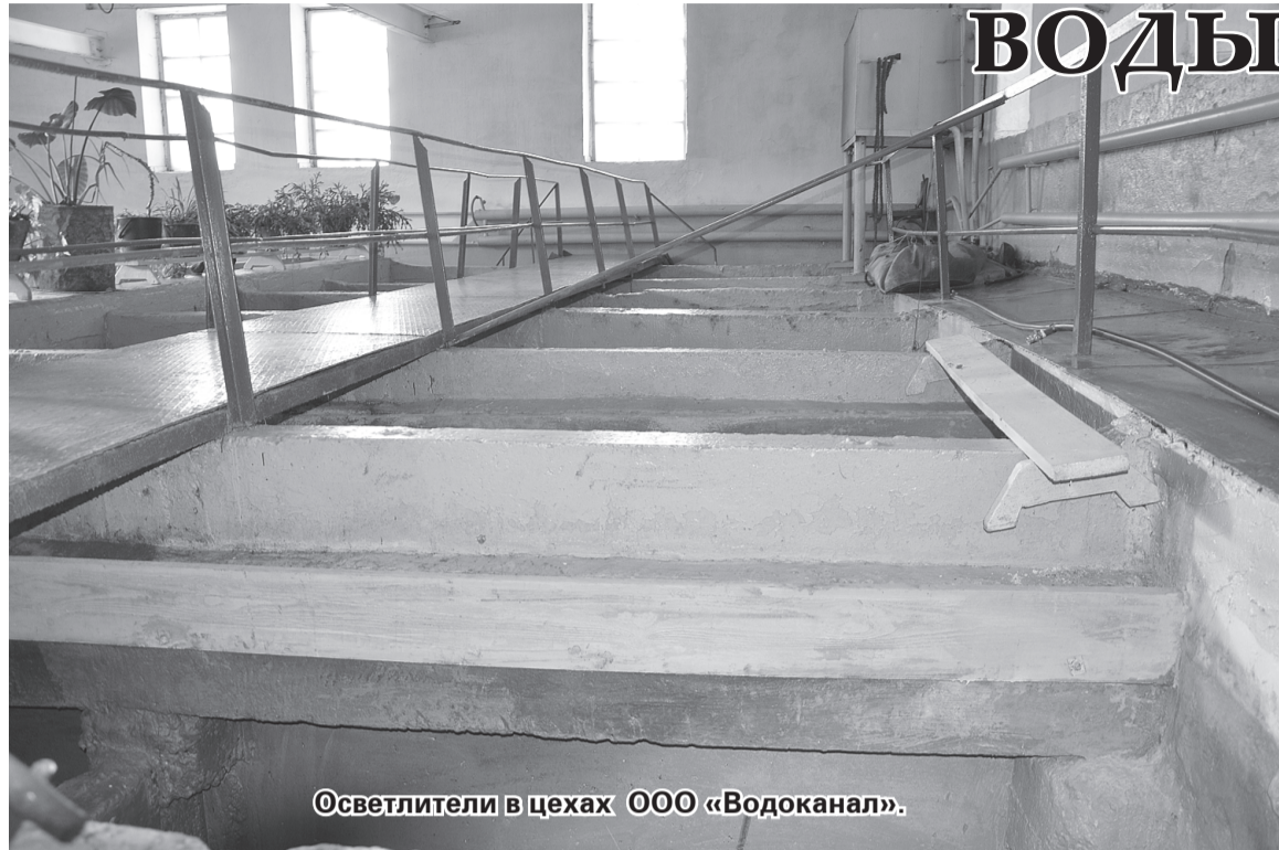
Осветители в цехах ООО «Водоканал».

По окончании летнего сезона на предприятии приступили к ремонту осветителей, которые функционируют вот уже более 45 лет. Естественно, те приспособления, которые в них находятся, давно уже пере-