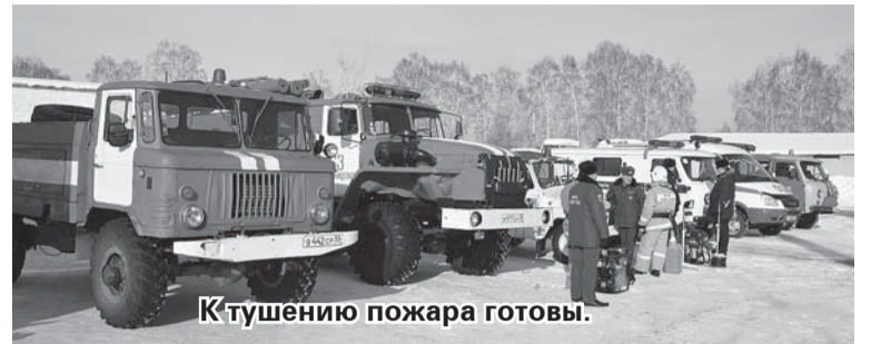
К тушению пожара готовы.

нал», Муромцевского газового участка, ДРСУ, САУ «Муромцевский лесхоз», Муромцевского линейно-технического цеха связи, МУП «Теплосеть 1», областной станции по борьбе с болезнями животных по Муромцевскому району, комитетов образования и культуры,