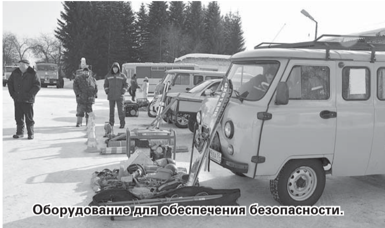
Оборудование для обеспечения безопасности.

В рамках подготовительных мероприятий к весенним паводкам, а также в целях профилактики лесных пожаров в Муромцевском муниципальном районе 6 марта прошёл смотр сил и средств, которые будут задействованы для обеспечения безопасности населения района. Подробнее об этом мероприятии мы поговорили с начальником Единой дежурной диспетчерской службы нашего района Евгением Портреткиным.