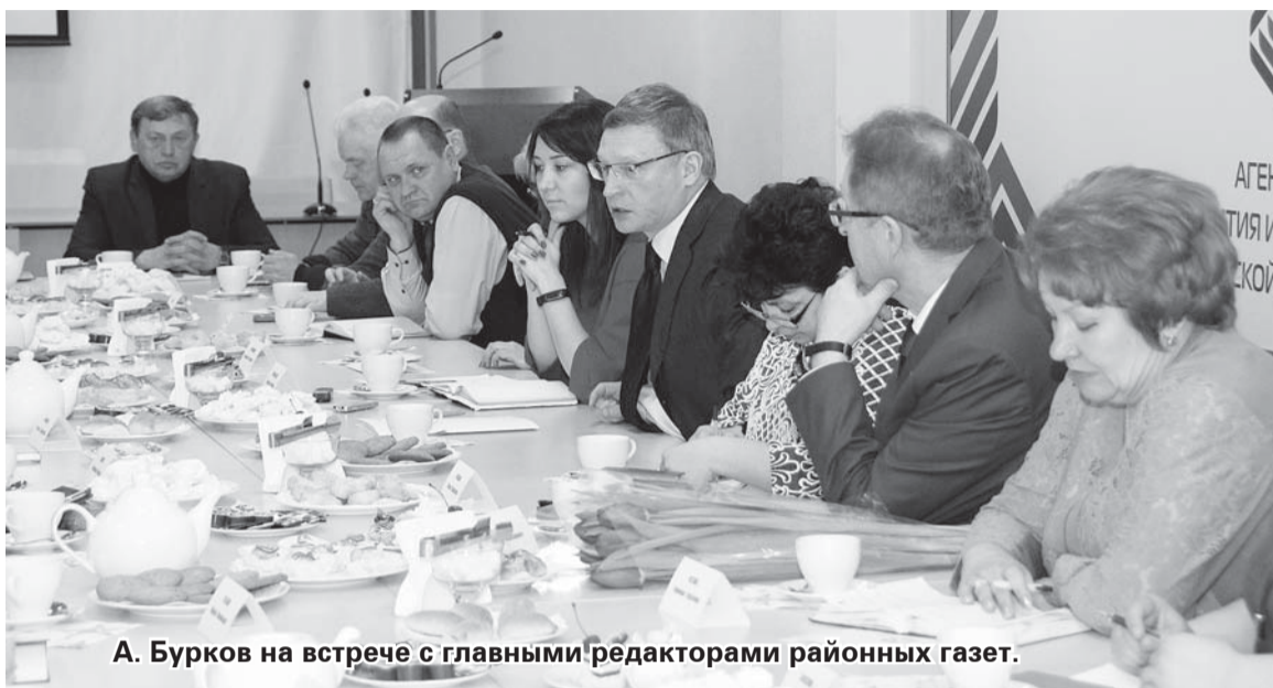
А. Бурков на встрече с главными редакторами районных газет.

нать, как показатель высокого уровня жизни, куда охотно едут работать омичи) Александр Бурков отметил: «Тюмень заточена на командное управление, на привлечение инвесторов. Наша задача сегодня - создавать условия для омичей, обеспечивать достойный уровень жизни населения, создавать точки роста, чтобы не было оттока населения из Омской области». Для выполнения поставленной задачи Правительство Омской области работает во взаимодействии с федеральной властью. На текущий год получено дополнительное финансирование региона на систему образования, здравоохранение, на выполнение майских указов президента, на газификацию области.