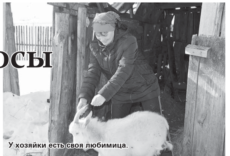
У хозяйки есть своя любимица.

в свои пять лет он наизусть читает целые поэмы и как чтец выступает на дошкольных фестивалях. Родители не только радуются успехам детей, но и показывают им во всём личный пример.