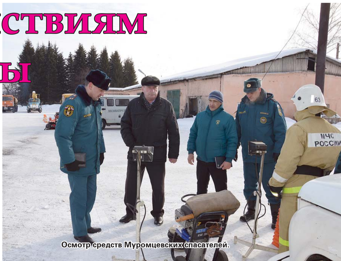
Осмотр средств Муромцевских спасателей.