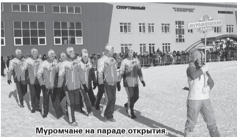
Муромчане на параде открытия.

Со 2 по 5 марта в Седельниково прошёл областной культурно-спортивный «Праздник Севера». В этом году хозяевам спартакиады выделили из региональной казны 5 млн рублей. Эти деньги пошли на ремонт помещений спортивного детско-юношеского центра, покупку оборудования для чистки снега и заливки льда, а также спортивного инвентаря.