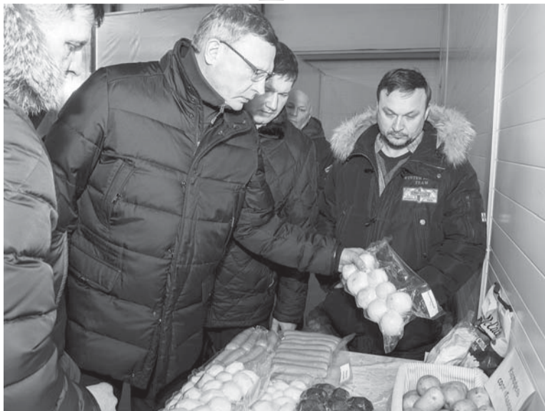
Продукция Ачаирского предприятия реализуется в крупные торговые сети: «Магнит», «Лента», «Ашан».

– Сейчас у нас задействована производственная линия