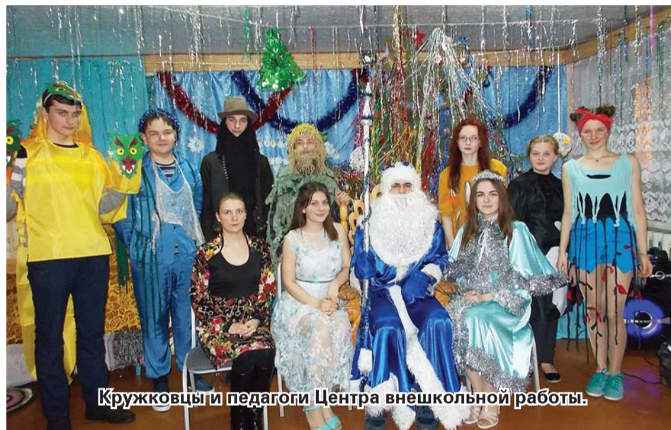
Кружковцы и педагоги Центра внешкольной работы.