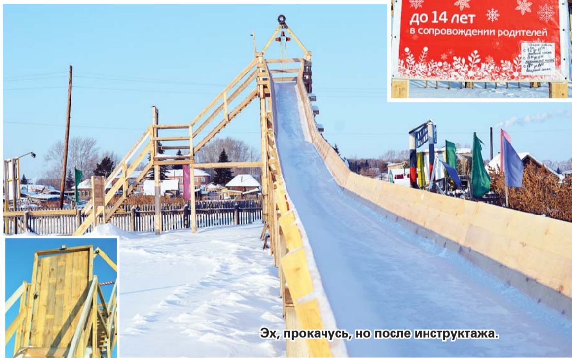
Эх, прокачусь, но после инструктажа.

Молва о «гуровской» горке разлетелась среди муромчан буквально в считанные дни. И сейчас туда едут получить удовольствие не только жители окрестных сёл и деревень, но и райцентра. Приезжали посмотреть на такое диво уже и гости из города.