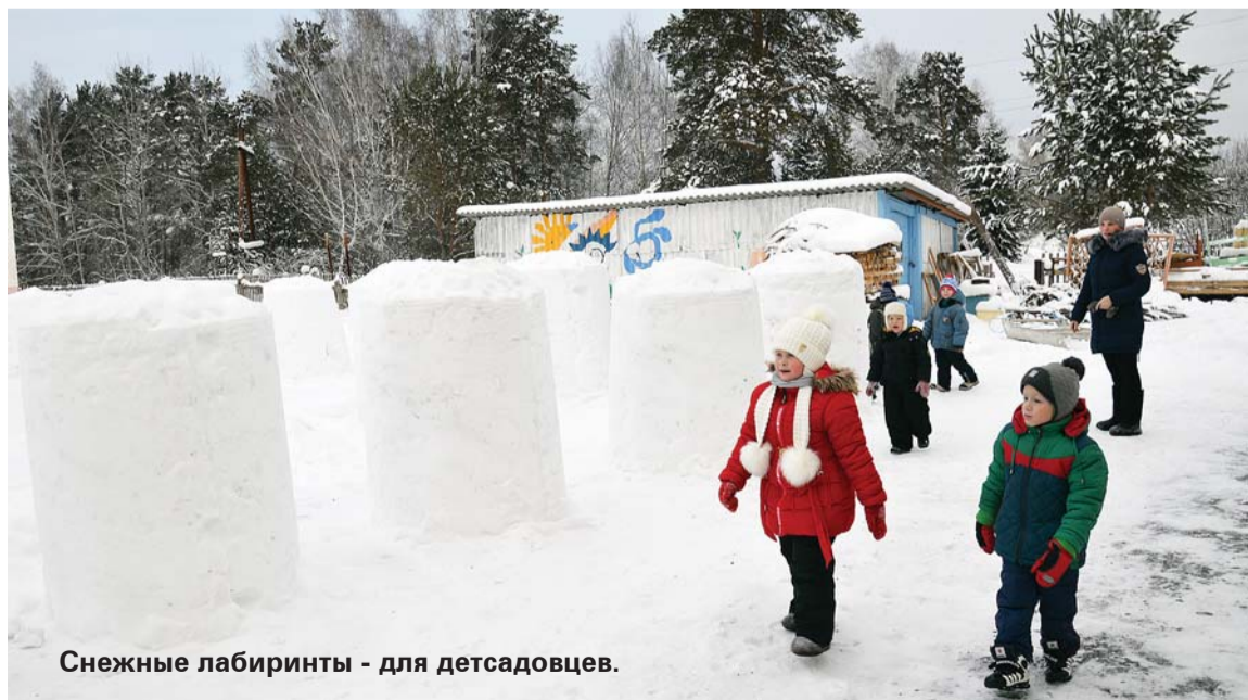
Снежные лабиринты - для детсадовцев.