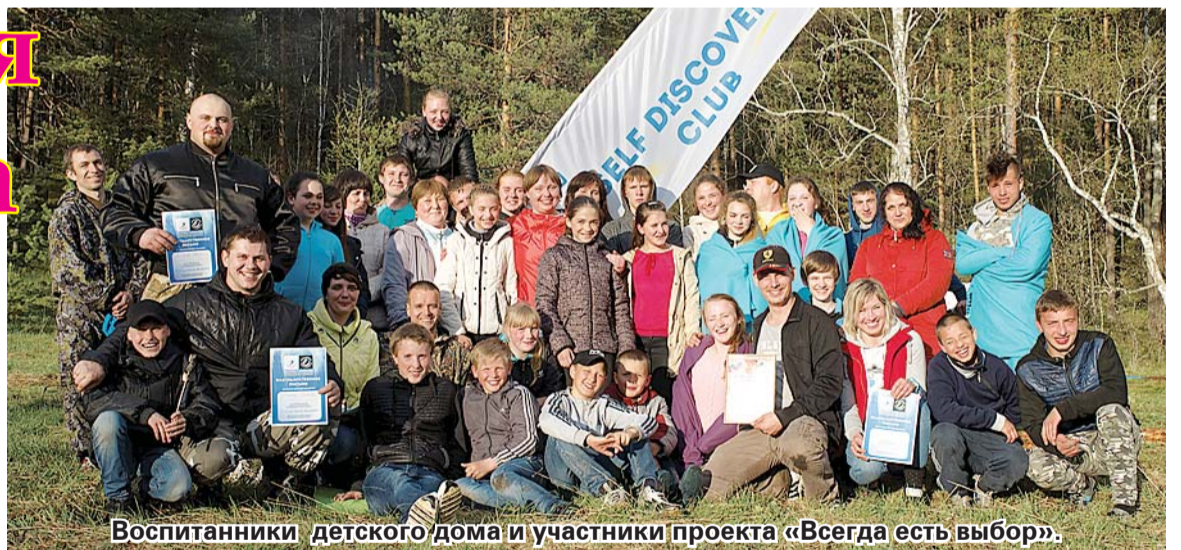
Воспитанники детского дома и участники проекта «Всегда есть выбор».

В конце дня все собрались у костра, чтобы попеть песни под гитару и сделать фото с гостями. Представители Центра силовой подготовки «Сила Сибири» оставили тёплые воспо-