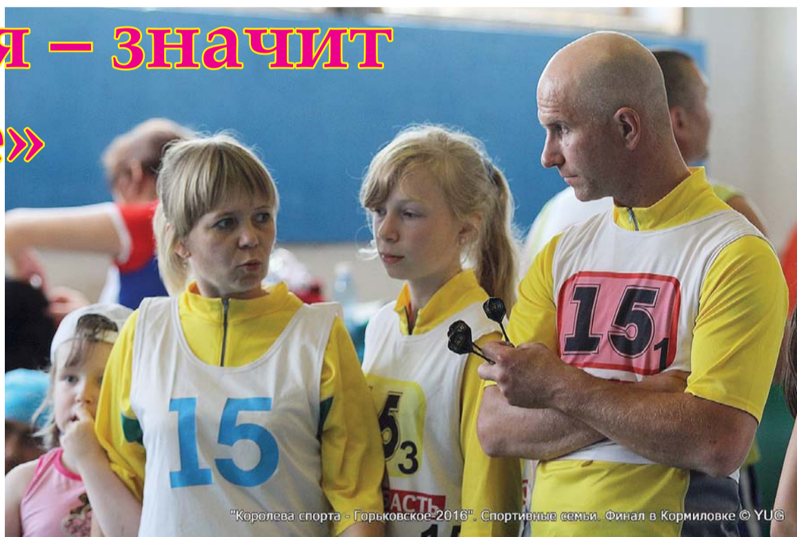
«Королева спорта - Горьковское-2016». Спортивные семьи. Финал в Кормиловке