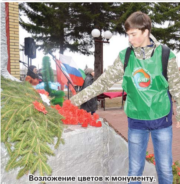
Возложение цветов к монументу.