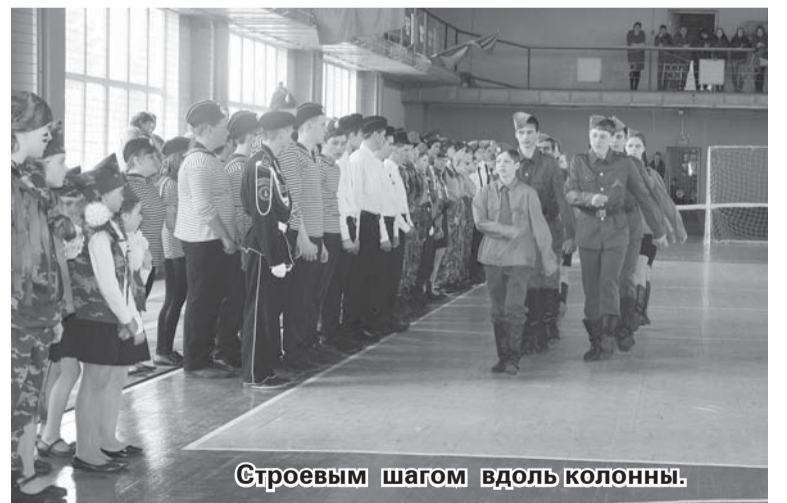
Строевым шагом вдоль колонны.

Все школы показали неплохой уровень строевой подготовки, но на шаг лучше других была команда лица, победившая сразу в трёх номинациях: «Лучшая строевая подготовка», «Лучший командир», «Лучшая форма». Бергамакская СОШ отличилась в двух номинациях: