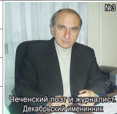
Чеченский поэт и журналист. Декабрьский именинник