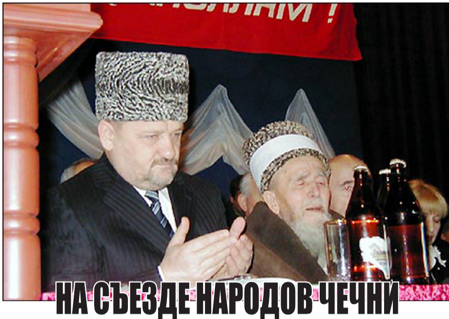
НА СЪЕЗДЕ НАРОДОВ ЧЕЧНИ

Делегаты первого съезда народов Чечни приняли принципиальное заявление, в котором подчеркивается, что Чечня - неотъемлемая часть России. «Мы - россияне, и хотим жить в составе нашей страны и по общим для всех народов России законам», - говорится в принятом обращении к народам Российской Федерации.