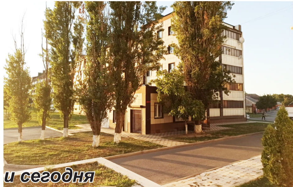
Гудермес: вчера и сегодня