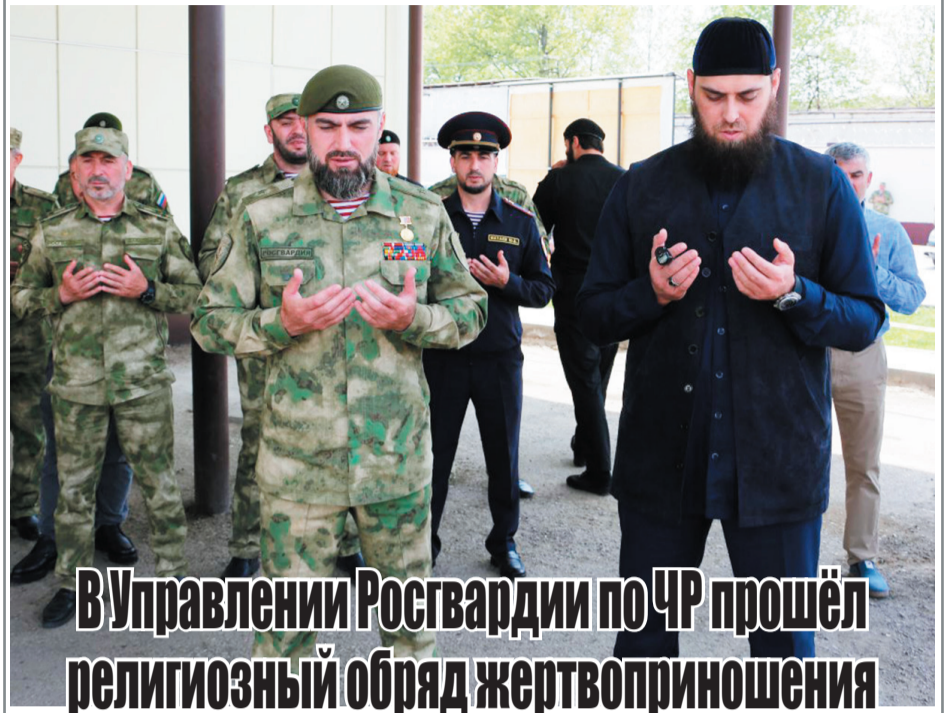
В Управлении Росгвардии по ЧР прошёл религиозный обряд жертвоприношения