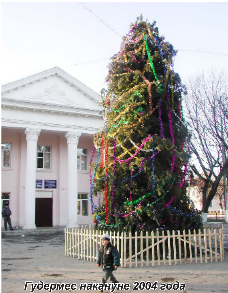
Гудермес накануне 2004 года