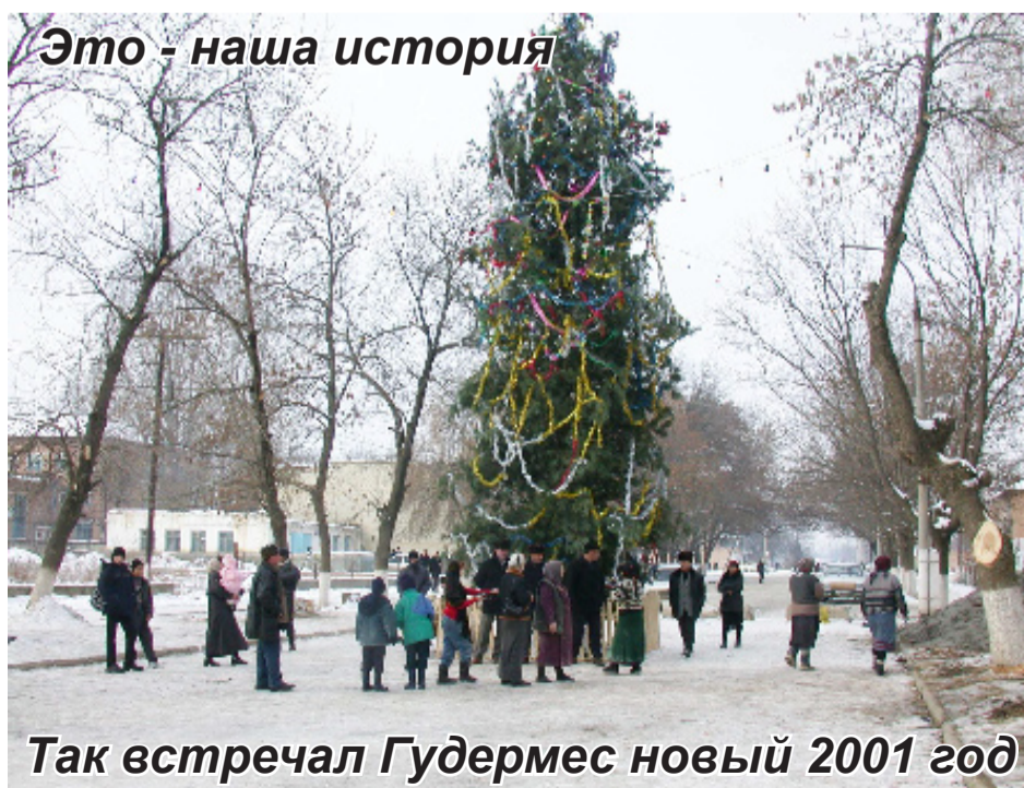
Это - наша история

Считать недействительным утерянный аттестат об среднем общем образовании за №02027000012743, выданный в 2016 году СШ №5 г.Гудермеса на имя САИДОВА МАГОМЕДА ХАДИСОВИЧА.