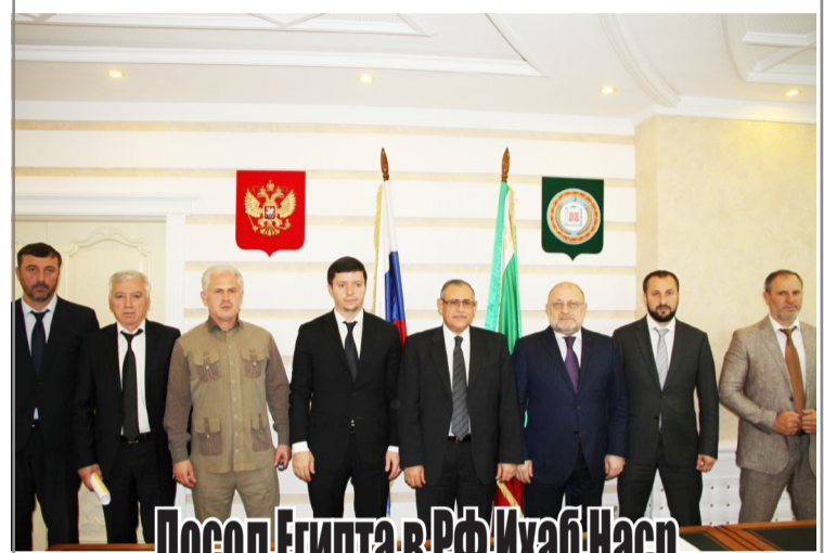
Посол Египта в РФ Ихаб Наср

Справки навести по телефонам: 8-871-52-2-22-58; 8928-890-07-50.