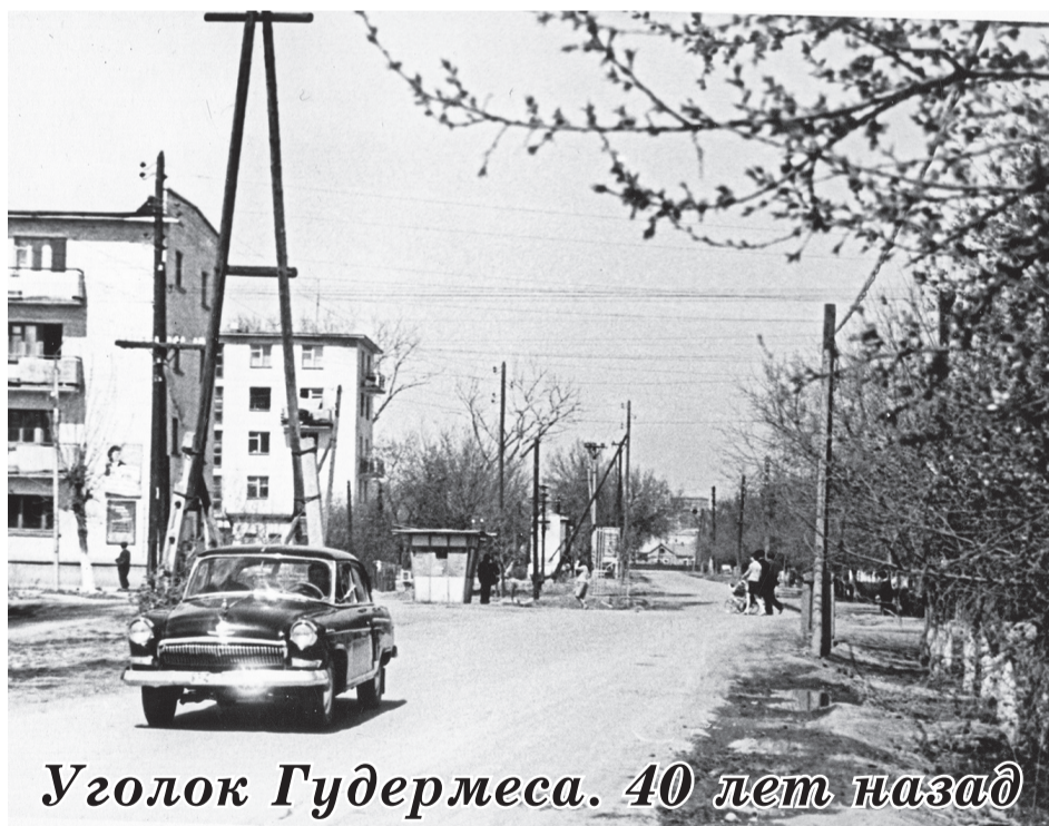
Уголок Гудермеса. 40 лет назад