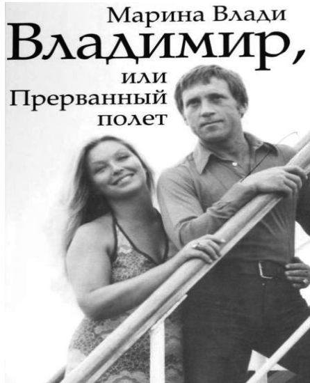
Обложка книги М. Влади о Высоцком

Купим дорого старинные иконы, от 50 000 руб. и выше. Тел. 8-910-885-38-33.