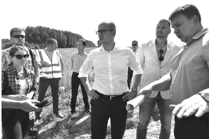
Важный принцип – приоритетная работа с «точками роста», то есть создание дорог к тем населённым пунктам, в которых есть не только социальная потребность, но и экономика: развиваются проекты, создаётся добавленная стоимость.

Он рассказал о формуле «5-3-2», которая станет базой для формирования общего плана дорожных работ в регионе на 2018 год. В соответствии с ней от каждого муниципалитета в краткий срок, до начала формирования бюджета-2018, должна поступить заявка на ремонт или строительство пяти дорог местного значения, трёх – межмуниципального значения и двух объектов дорожной