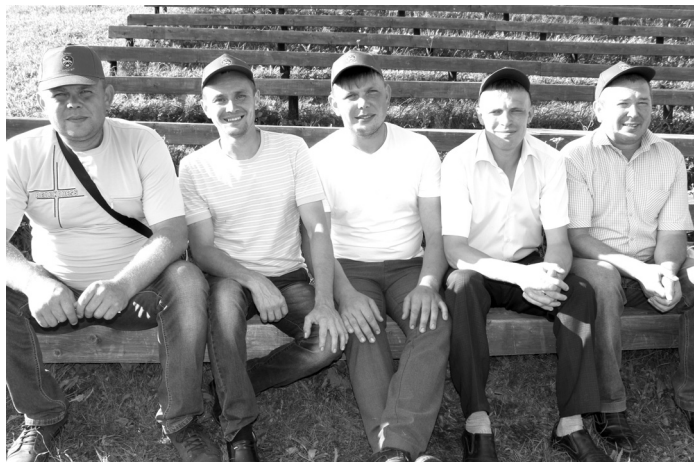
Фермеры - участники делегации Юкаменского района.