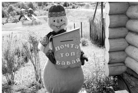
Главное моё пожелание: «Пусть процветает фермерство в Удмурти!».