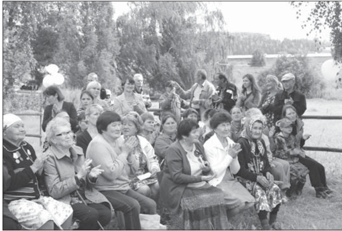
□ Пока люди собираются на праздники бывших деревень, память о них жива.