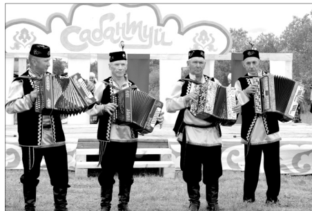
Гармонисты не давали никому скучать.