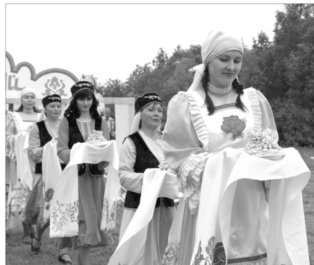
Гости праздника отведали знаменитое татарское угощение «чак-чак».

Большее количество фотографий смотрите на сайте газеты: ukam-gazeta.ru