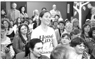
Корреспондент дебесской газеты «Новый путь» задает вопрос врио главы республики.

К журналистам приехал врио Главы Александр Бречалов. Он выразил уверенность, что руководству республики удастся выстроить конструктивный диалог с прессой и привлечь журналистов к честной, открытой и объективной работе.