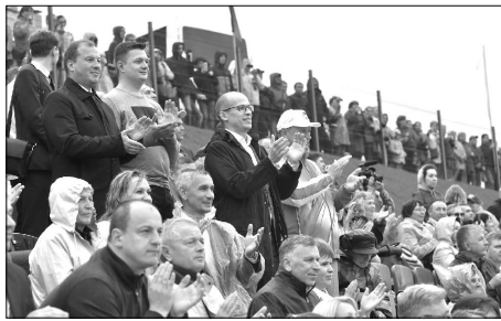
▲ Апплодисментами встречают на трибуне спортсменов республики высокие гости и зрители.

спорту, перетягиванию каната, вольной борьбе, дзюдо, соревнованиям спортивных семей и руководителей районов (стрельба, дартс, городошный спорт). В финале встретились лучшие из лучших, те, кто успешно прошел все отборочные этапы сельских игр, прошедшие в тех или иных районах.