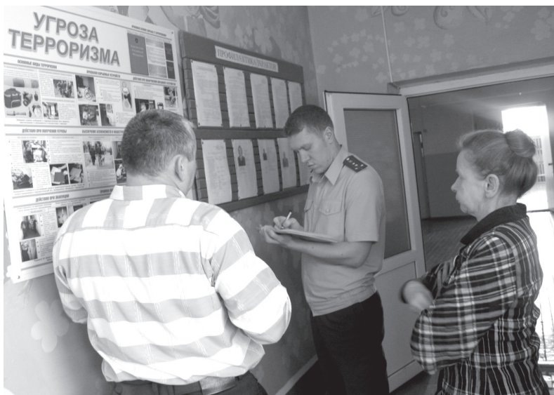
Проверка в Юкаменской школе.

Кроме того, проверкой выявлены и иные наруше-