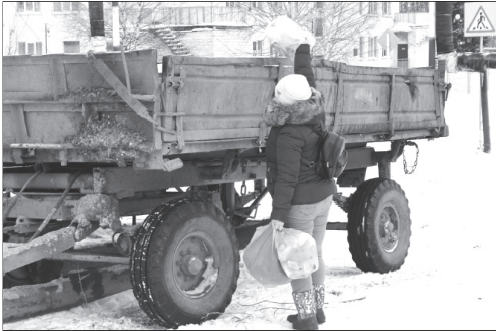
Такие тележки для мусора около многоквартирных домов с. Юкаменское будут стоять и в дальнейшем.