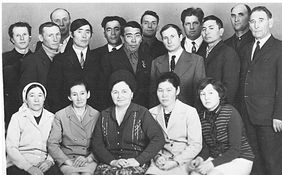
1975 год. Слёт передовиков Енотаевского района. На фото: передовики производства и руководители совхоза «Табун-Арал».