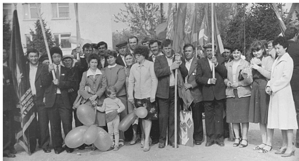
80-е годы. Коллектив Лесхоза.