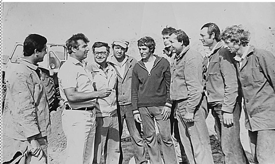
Строительная бригада ПМК-13, 1987 год.