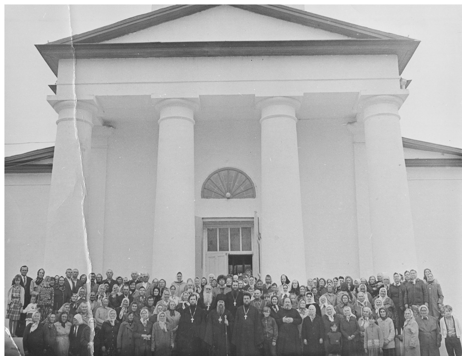
Открытие Свято-Троицкого кафедрального собора после реставрации. 1990 г.