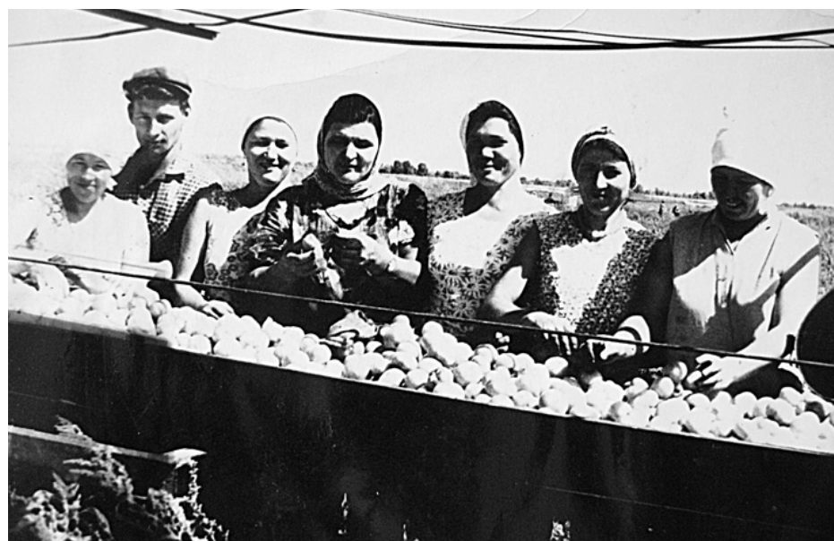
Овощеводческие бригады колхоза «Строитель коммунизма» (с. Фёдоровка, приблизительно 1974 год).