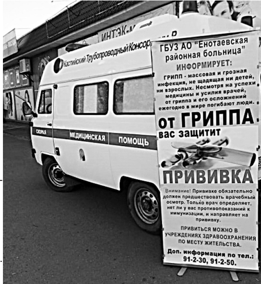
ГБУЗ АО «Енотаевская РБ».

взрослых - 11140, детей - 3860. Поступила вакцина в количестве 4600 доз: взрослых - 3000 доз, детей - 1600 доз. Привито на 15.09.2020 г. 2079 взрослых, 600 детей.