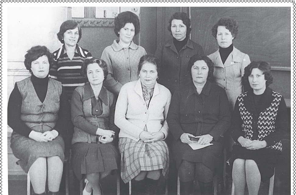
с. Енотаевка. 1980 г. Фронтальная проверка сероглазинской 8-летней школы работниками района.