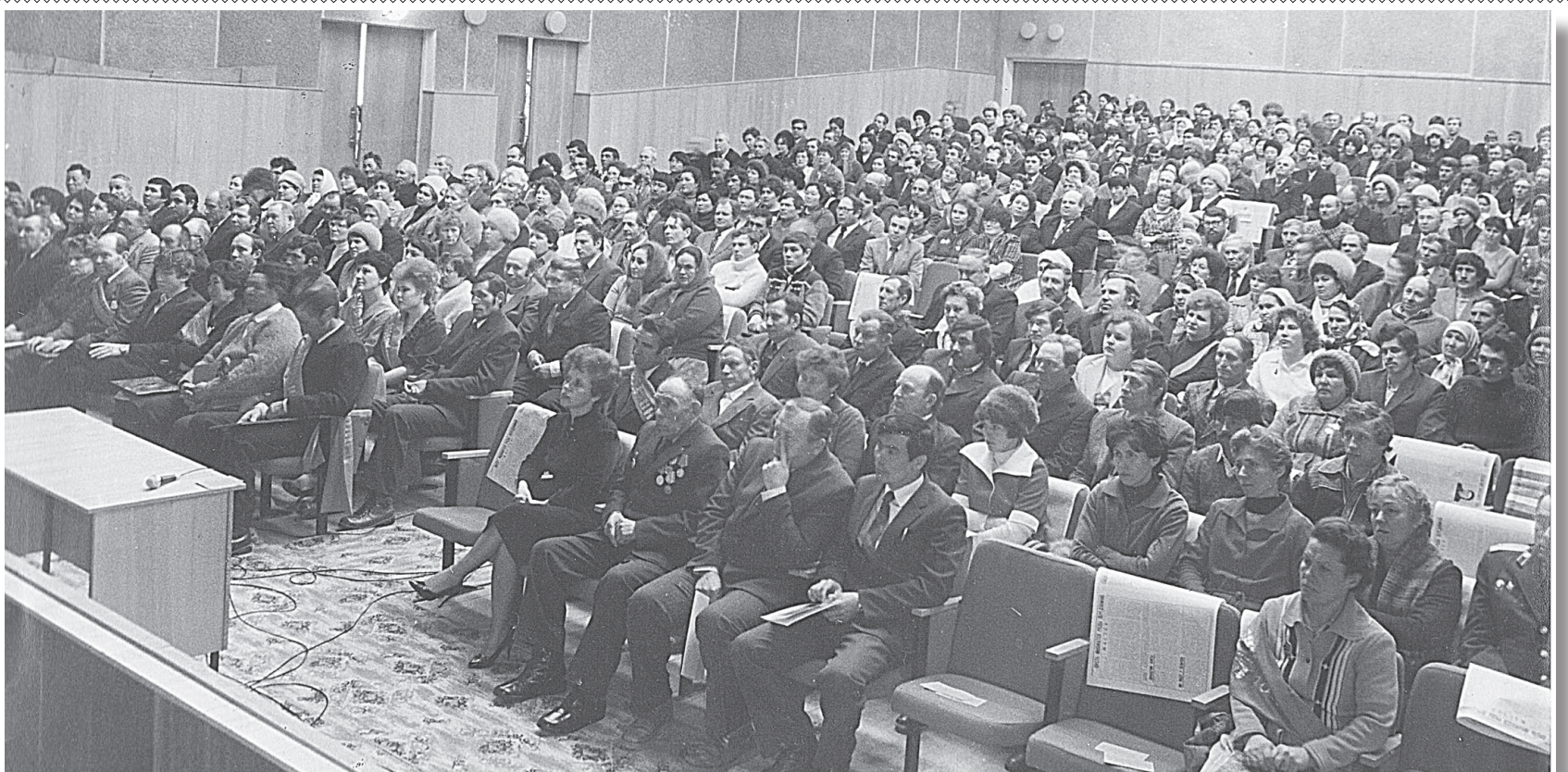
80-е годы. Слет передовиков социалистического соревнования в новом здании Дома культуры с. Енотаевка.