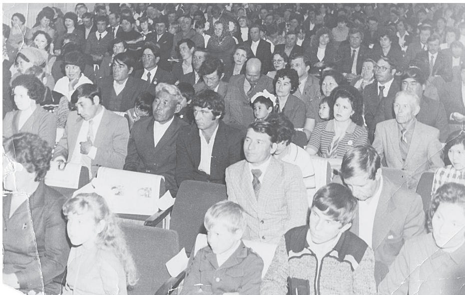
Фото из архива Н.М. ШАЛАЕВОЙ, с. Енотаевка. 1982 г. Слёт трудовых династий в старом ДК с. Енотаевка