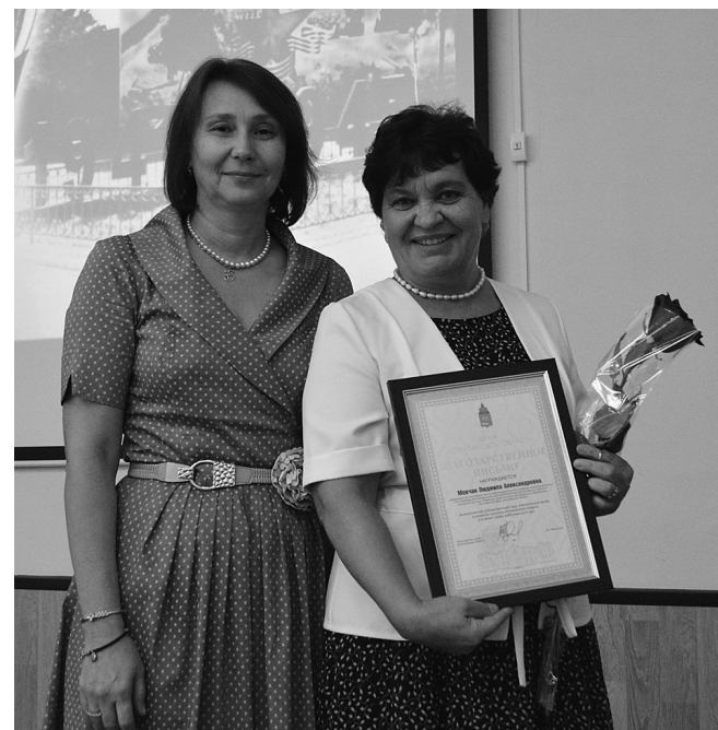
землякам, победителям конкурса.