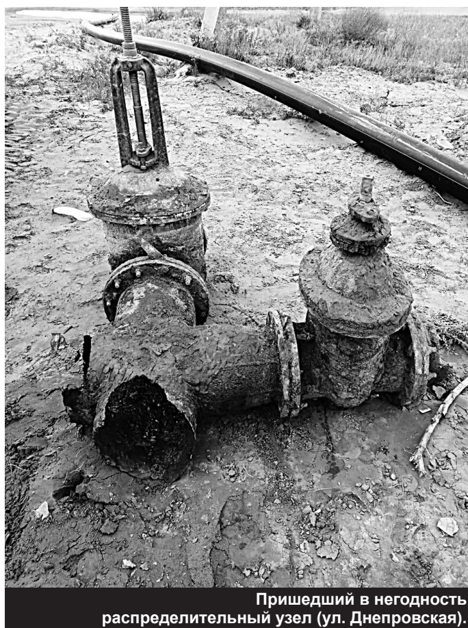
Пришедший в негодность распределительный узел (ул. Днепровская).

Я очень много слышу негатива как в свой адрес, так и в адрес моих коллег. Мы не оправдываемся, так как понимаем, что вверенную нам сферу деятельности мы обязаны содержать в порядке. Но поверьте, мы делаем все необходимое, чтобы побыстрее устранить аварию, а наши жители не испытывали дискомфорта. Кто-то считает забавным, как это сделала одна жительница с. Енотаевка, позвонить на «горячую линию» Правительства области и пожаловаться, что в её дворе нет воды 3 месяца. При выезде бригады по указанному