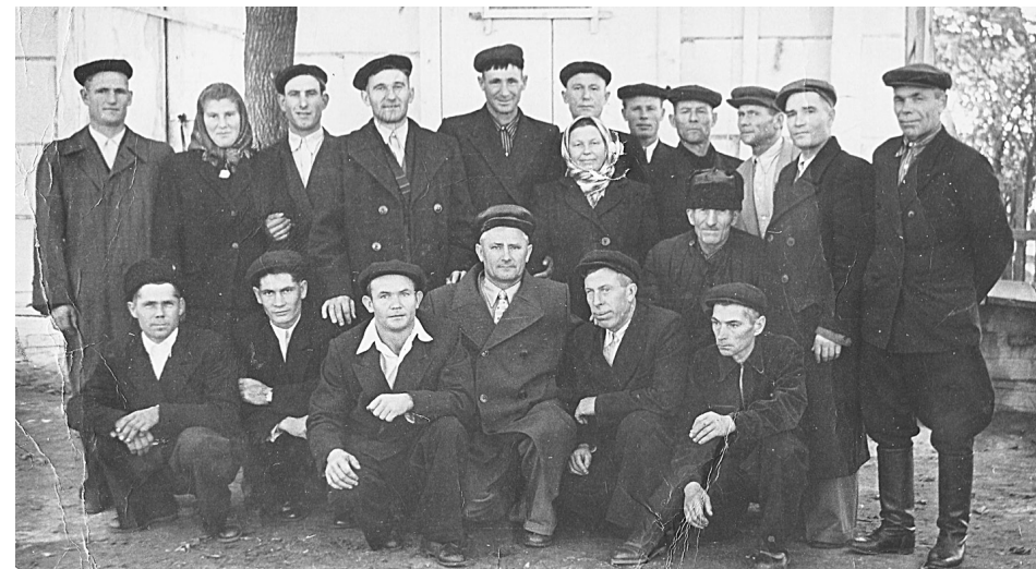
1964 год. Коллектив д/с «Василёк».