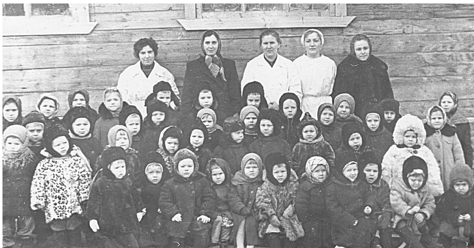
1957 год. Коллектив КБО (сотрудники строительного, валяльного и др. цехов).

Начало 60-х годов. Коллектив д/с «Василёк».