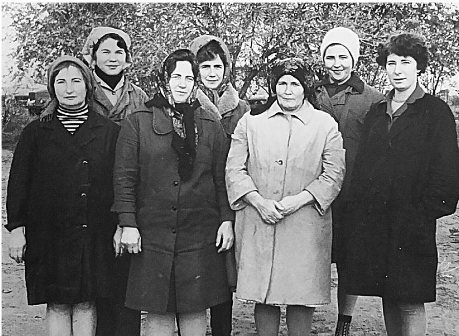
На полях, 1957 год.