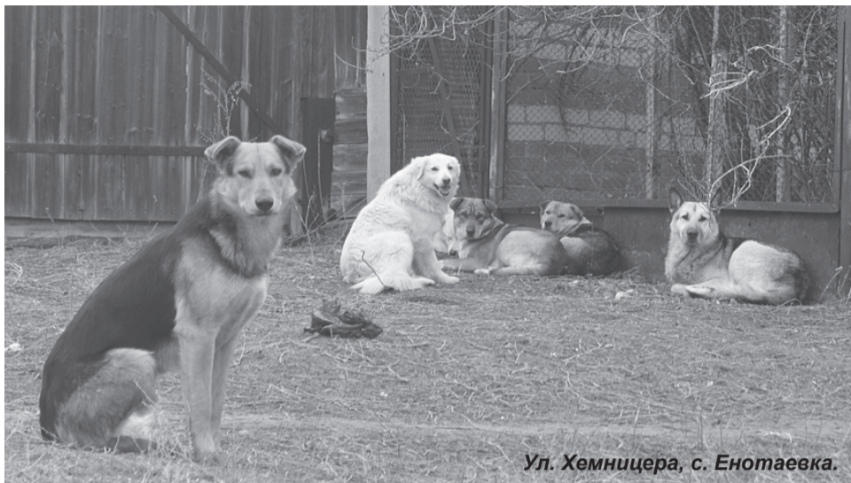
Ул. Хемницера, с. Енотаевка.

- Когда же местная власть наведёт порядок в селе с бродячими собаками? – взволнованно спрашивала пожилая женщина, придя к нам в редакционный отдел. - На днях одна из них укусила мою внучку, теперь она получает 40 уколов противостолбнячной прививки. А как потом эта вакцина от бешенства отразится на её здоровье – одному Богу известно. И таких укушенных в селе много. Мало того, что «бродяжки» сбиваются в агрессивные стаи, к ним зачастую присоединяются и домашние псы, выпущенные сердобольными хозяевами порезвиться на улице. Раньше такого обилия собак на улицах Енотаевки не наблюдалось. Почему же последние несколько лет пешим енотаевцам всё труднее пройти по селу, не опасаясь за своё здоровье?