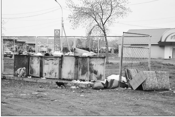
Снимки сделаны на прошедшей неделе. Двухмесячник по благоустройству и санитарной очистке закончился. Ничего не изменилось.