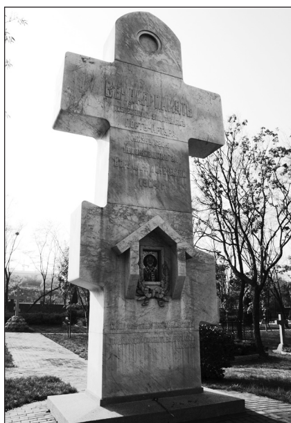
Христианский крест в память о защитниках Порт-Артура.