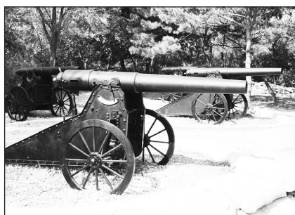
Крепостные пушки – ныне экспонат для туристов.

Константин ЛОБКОВ, спец. корр. газеты МО РФ «Красная звезда» по Восточному военному округу.