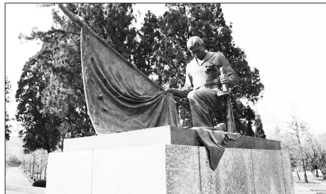
На Русском кладбище.

...Поднялись наши ветераны и на гору Высокую, где 110 лет назад бились до последнего русские воины и откуда потом вела губительный огонь дальнотбойная артиллерия японцев по позициям в крепости. С неё хорошо просматривается вся гавань, где когда-то стояла эскадра Российского императорского флота, а ныне базируются корабли ВМС