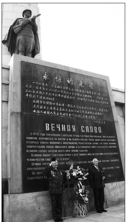
У памятника советским воинам, погибшим при освобождении Китая.