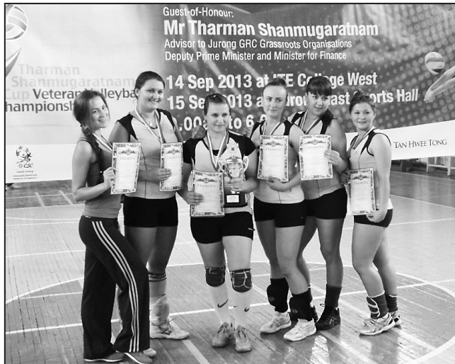
Гордость нашего района - волейболистки из Самарки