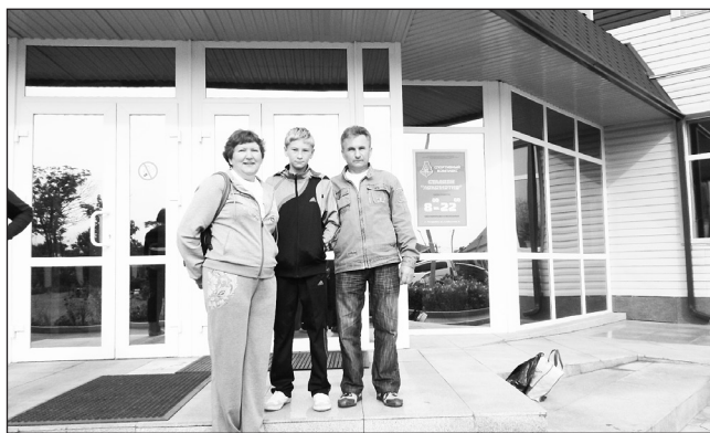
Чугуевская семья - четырехкратный призер соревнований

команд Приморского края, к коим относятся команды Спасского, Надеждинского, Черниговского, Михайловского и Октябрьского районов Приморского края. Спортивные руководители края ставят наш район в один ряд с ними, благодаря высоким местам чугуевских спортсменов на Спартакиадах по таким видам спорта, как мини-футбол, женский волейбол,