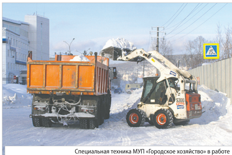
Специальная техника МУП «Городское хозяйство» в работе