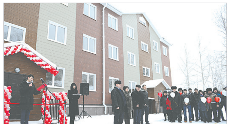
В конце года был сдан в эксплуатацию новый ведомственный дом для железнодорожников. Администрация города и в дальнейшем рассчитывает на сотрудничество с предприятиями города по строительству жилья

питального ремонта центральной улицы города (ул. Строителей, ул. Янгеля, ул. Радищева), по подготовке проекта устройства парка в зеленой зоне в районе искусственного водоема в 10 квартале, а также о проводимой работе по благоустройству дворовых территорий и общественных пространств.