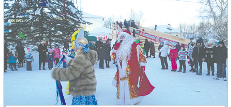
В этот Новый год, благодаря пожеланиям жителей города, было решено вспомнить прошлое и вернуться к расположению снежного городка на площади у гостиничного комплекса «Магнетит»

На встрече с представителями областного правительства были озвучены планы администрации города по подготовке проекта ка-