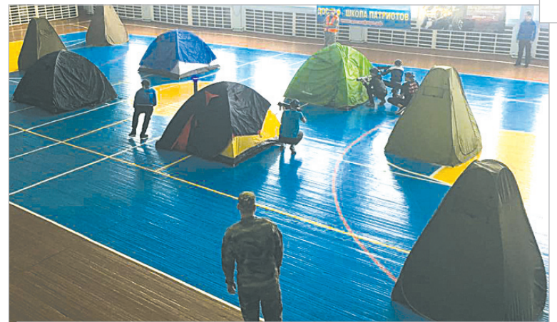
Впервые в городе провели соревнования между школами по лазертагу. Для нашей молодежи и школьников эта игра стала настоящим событием