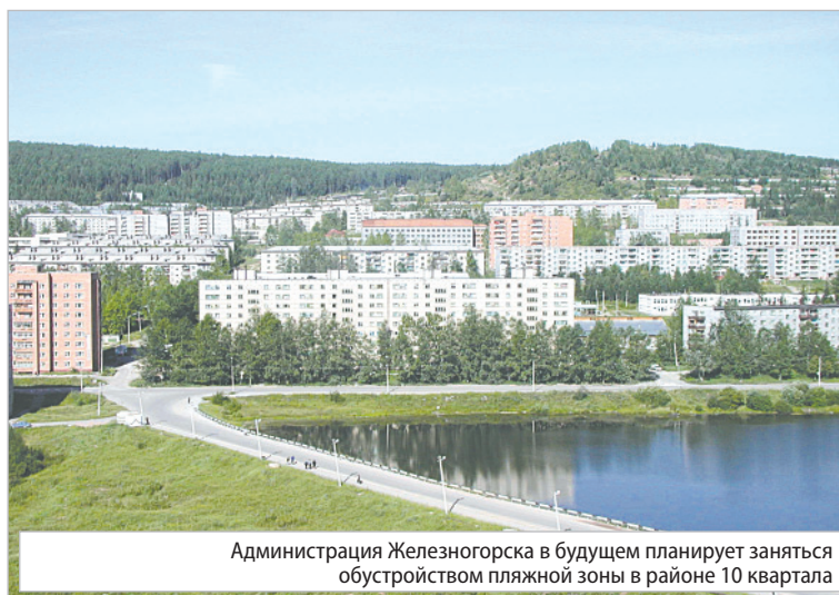
Администрация Железногорска в будущем планирует заняться обустройством пляжной зоны в районе 10 квартала