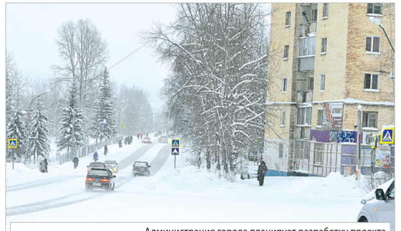
Администрация города планирует разработку проекта капитального ремонта автодорог города