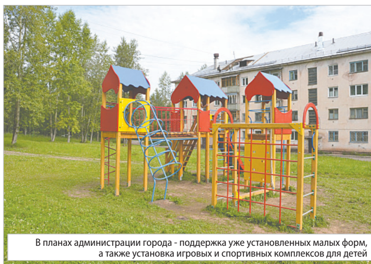
В планах администрации города - поддержка уже установленных малых форм, а также установка игровых и спортивных комплексов для детей