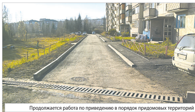
Продолжается работа по приведению в порядок придомовых территорий