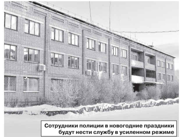
Сотрудники полиции в новогодние праздники будут нести службу в усиленном режиме

Не бросайте ценные вещи и сумки в автомоби-