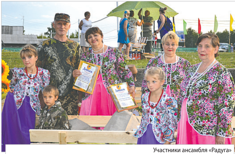
Участники ансамбля «Радуга»

октября в г.Иркутск на Областной праздник «Я горжусь, что родился в Сибири», и областной фестиваль хоровых коллективов и вокальных ансамблей «Пюющее Приангарье», которые проводились в рамках акции XXI Дни русской духовности и культуры «Сияние России» Иркутской области – коллективу «Радуга» вручены Дипломы.