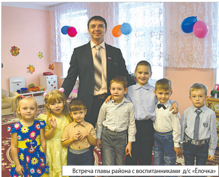
Встреча главы района с воспитанниками д/с «Ёлочка»