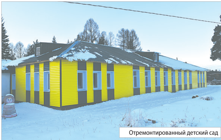
Отремонтированный детский сад