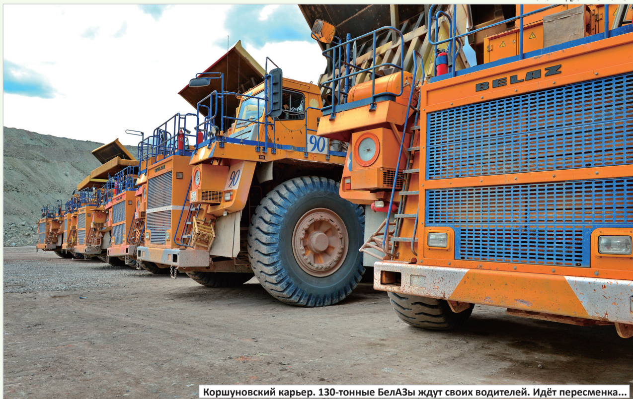
Коршуновский карьер. 130-тонные БелАЗы ждут своих водителей. Идёт пересменка...