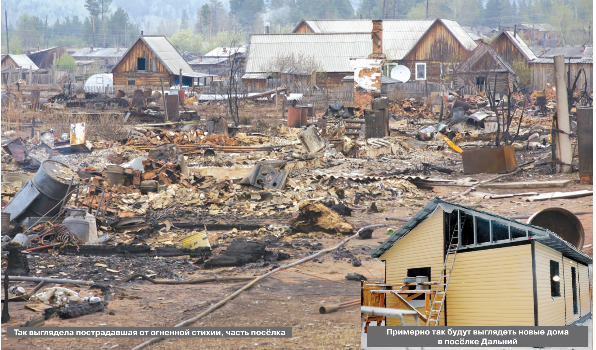
Так выглядела пострадавшая от огненной стихии, часть посёлка