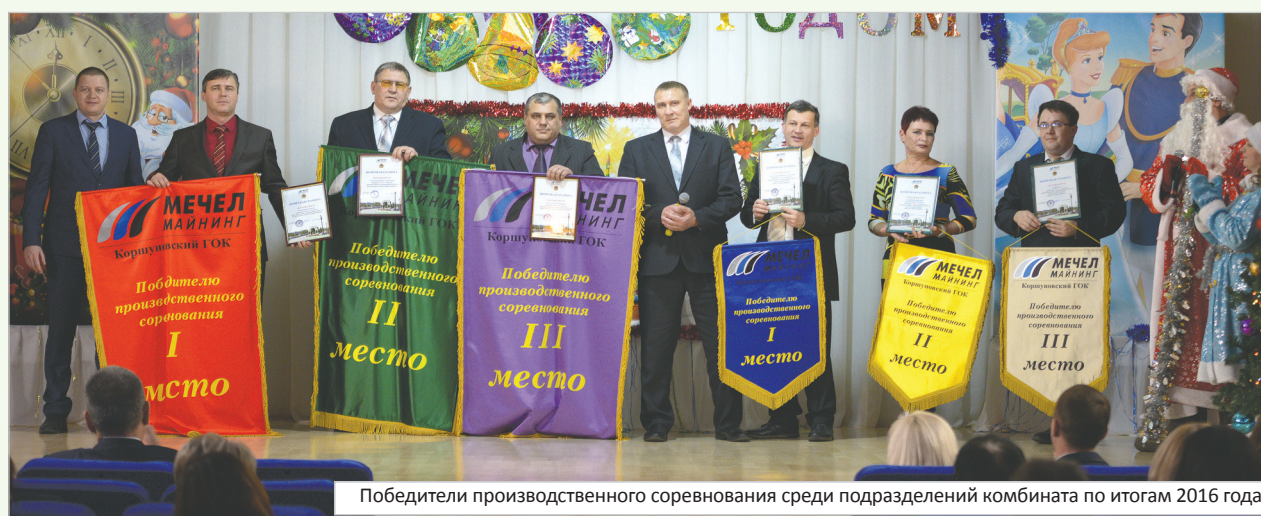
Победители производственного соревнования среди подразделений комбината по итогам 2016 года