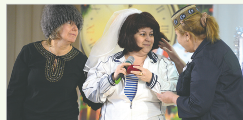
Сценка по мотивам к/ф «Кавказская пленница»