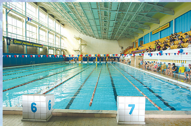
В этом году все муниципалитеты области получат дополнительное финансирование для решения актуальных проблем. Нижнеилимскому району дополнительно выделено 13,7 миллиона рублей. Помимо этого на ремонт оздоровительного комплекса «Дельфин», выделено еще 6 млн. рублей