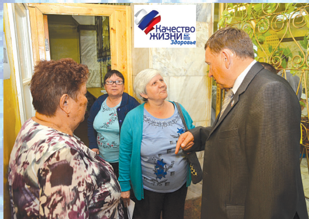
Традиционная «Ярмарка здоровья» проводится в рамках программы оздоровления населения области. В этом году более 400 жителей поселков Нижнеилимского района получили консультации специалистов Иркутской областной клинической больницы