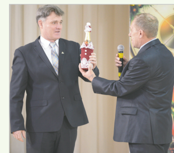
Передача символической эстафеты от начальника РЭМЦ начальнику ЦСХ