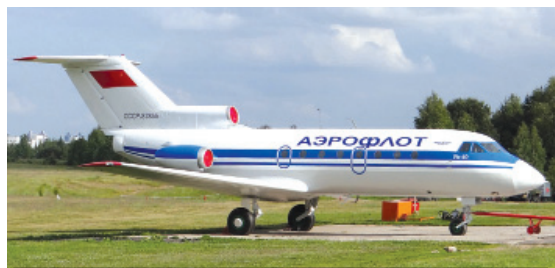
Когда-то Железногорский аэропорт принимал по несколько рейсов в день из Иркутска и Братска

В проекте областного бюджета на 2016 год предусмотрены субсидии для местных авиалиний, в том числе на рейсы из Иркутска в Железногорск-Илимский. Стоимость билетов, большая часть которой компенсируется из бюджета области, останется прежней. Однако расходы на содержание взлетной полосы и служб аэропорта пока ложатся на администрацию района.