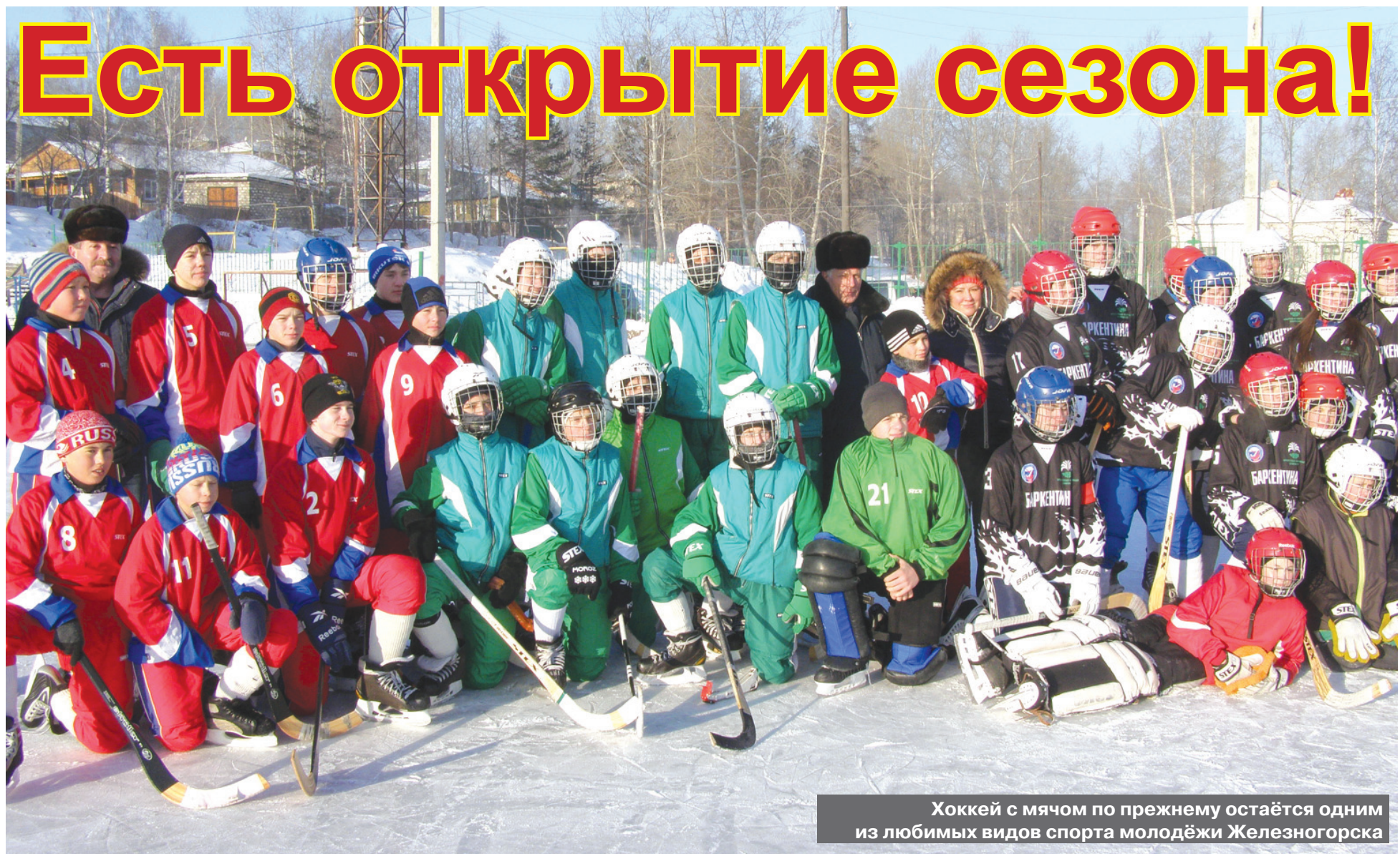
Хоккей с мячом по-прежнему остаётся одним из любимых видов спорта молодёжи Железногорска

29-30 ноября на стадионе «Строитель» прошли соревнования по хоккею с мячом, посвященные открытию зимнего спортивного сезона, организаторами которых выступили: администрация Железногорск-Илимского городского поселения, МАУ «Оздоровительный комплекс» и спортивный клуб «Баркентина». В состязаниях приняли участие две команды из города Усть-Илимска и сборная хозяев турнира – города Железногорска-Илимского