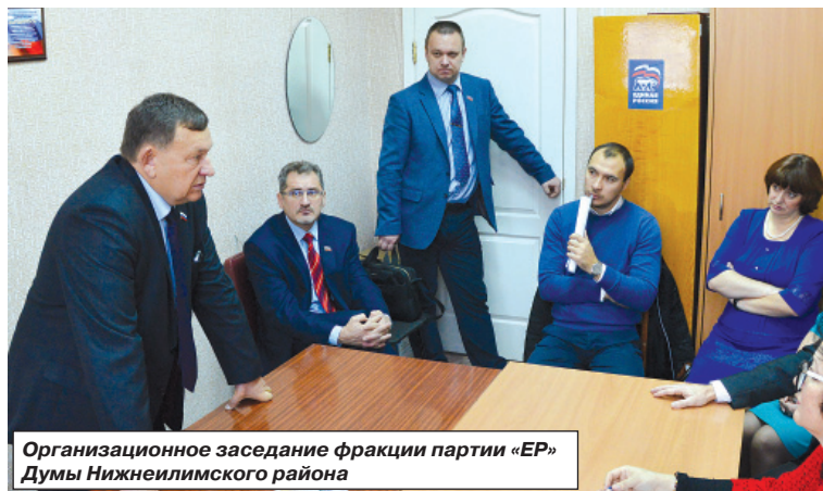
Организационное заседание фракции партии «ЕР» Думы Нижнеилимского района