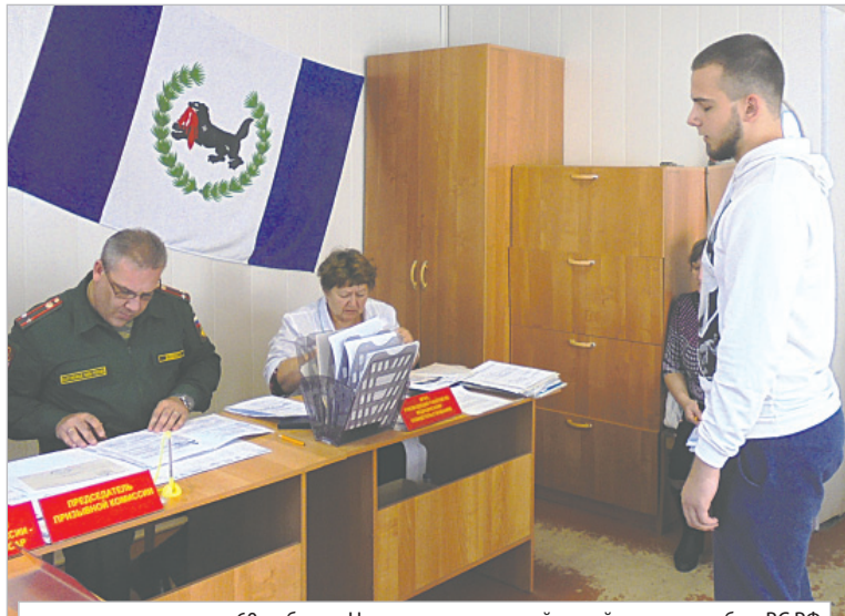
60 ребят из Нижнеилимского района уйдут на службу в ВС РФ

1 октября во всех городах России началась осенняя призывная кампания. В этом году военный комиссариат Нижнеилимского района планирует призвать на срочную службу более 60 молодых людей