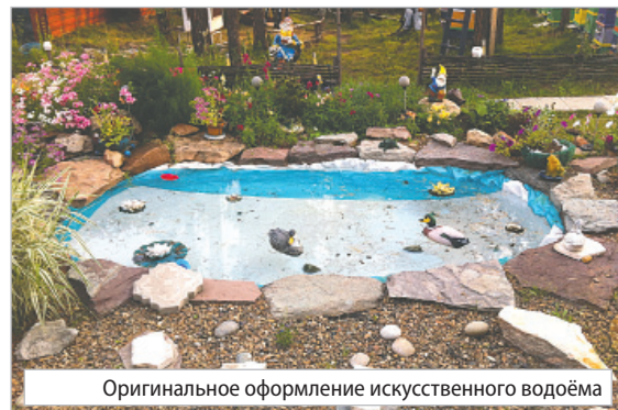
Оригинальное оформление искусственного водоёма

Комиссия оценивала выполнение условий конкурса