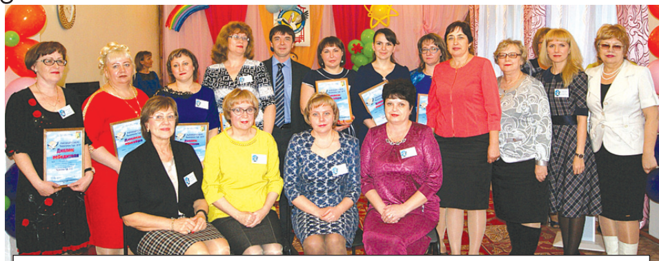
Фотография на память о конкурсе «Воспитатель года – 2015»