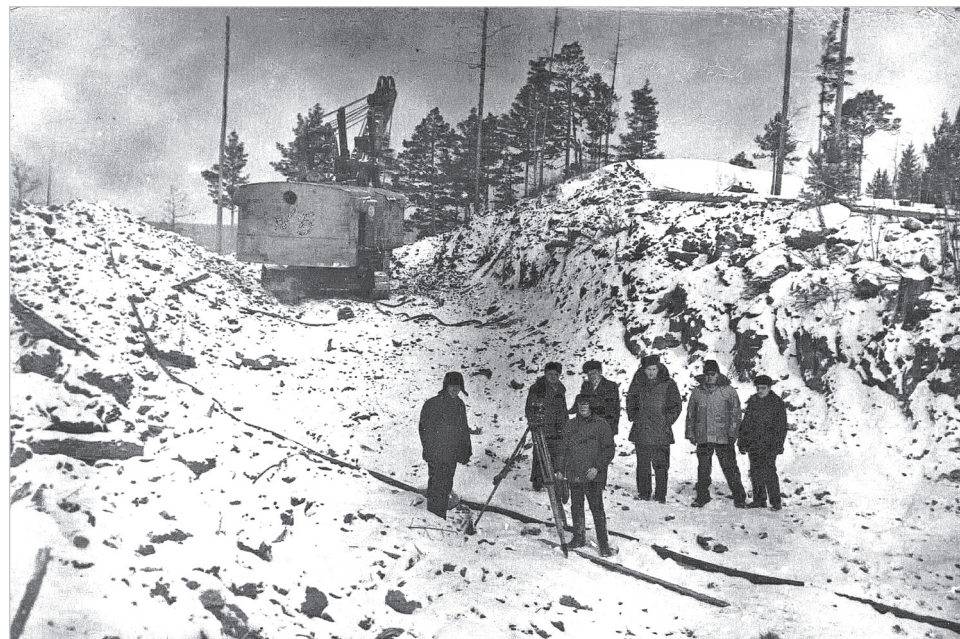
Горизонт 500 Коршунновского карьера. Именно отсюда была отгружена первая тонна руды. К сожалению, в архивах нет фотографий момента погрузки первой руды. Сохранился этот снимок тех лет. Кто на нем – неизвестно. Если кто-то из наших читателей узнает на фотографии знакомых – редакция будет признательна.

15 декабря 1964 года в Коршунновском карьере была отгружена первая тонна железной руды