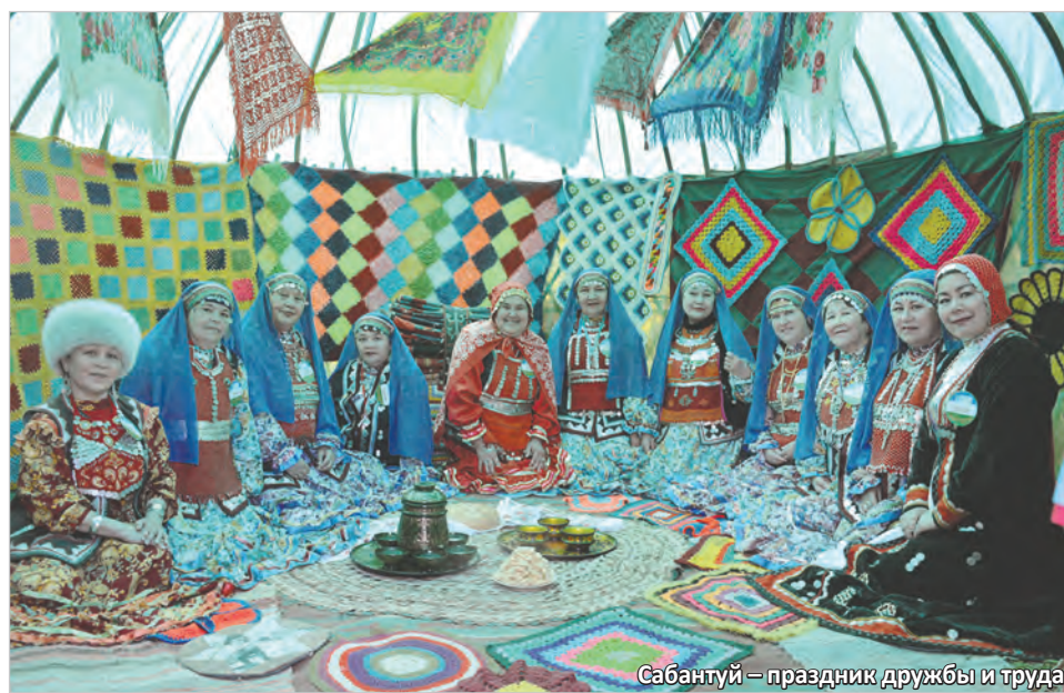
Сабантуй – праздник дружбы и труда

По материалам корпоративных изданий ПАО «Мечел»