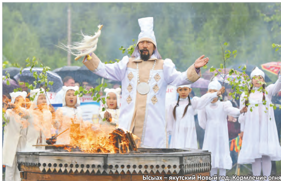
Ысыах – якутский Новый год. Кормление огня