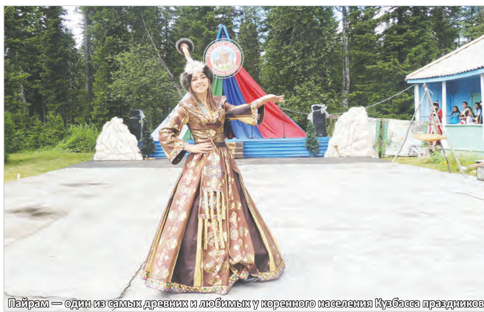
Пайрам – один из самых древних и любимых у коренного населения Кузбасса праздников