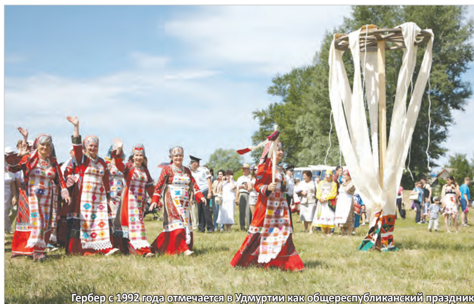
Гербер с 1992 года отмечается в Удмуртии как общереспубликанский праздник