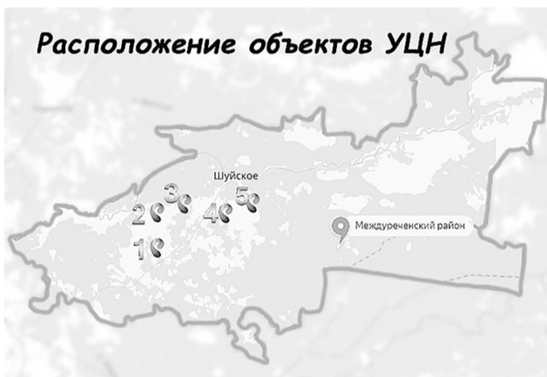
1-Игумницево, 2- село Старое, 3- Спасс-Ямщики, 4-Шейбухта, 5- Врагово.

На территории Междуречья такими объектами устранения цифрового неравенства (далее-УЦН) обзавелись несколько населенных пунктов, в их числе: Игумницево, село Старое, Спас-Ямщики, Шейбухта и деревня Врагово. Эти инженерные сооружения обеспечивают свободный доступ к сети интернет. Для пользования этой услугой необходимо устройство, имеющее на своем борту модуль «Wi-fi» - проще говоря, нужен либо ноутбук, либо смартфон или планшет. Также возможно подключение к сети путем применения USB-приемников «Wi-fi». Процедура подключения и авторизации довольно проста - необходимо находится в радиусе покрытия объекта УЦН до 50 метров. Эти «Wi-fi»-столбы располагаются у местных домов культуры. Их легко отличить и найти: как правило, на вершине столба есть антенна с двумя цилиндрическими элементами, а ниже располагается средних размеров щиток управления. Итак, к регистрации, чтобы пользоваться интернетом, нужно подключиться к сети «Rt-open», затем пройти процедуры регистрации в появившемся окне либо открыть любой браузер, где появится страница регистрации. На ней необходимо найти иконку в виде ключа и создать учетную запись в личном кабинете с помощью номера мобильного телефона. Далее выбрать услугу «Wi-fi» - в сельской