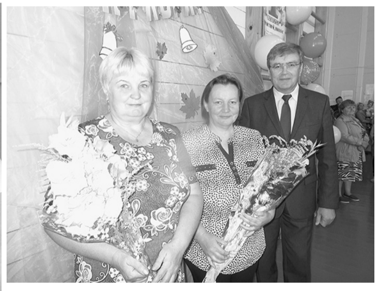
На торжественной линейке.