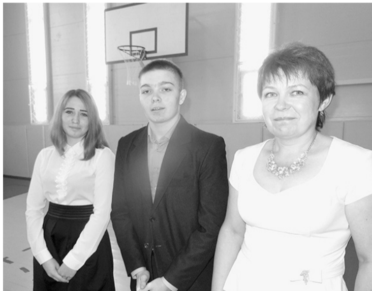
Выпускной класс.