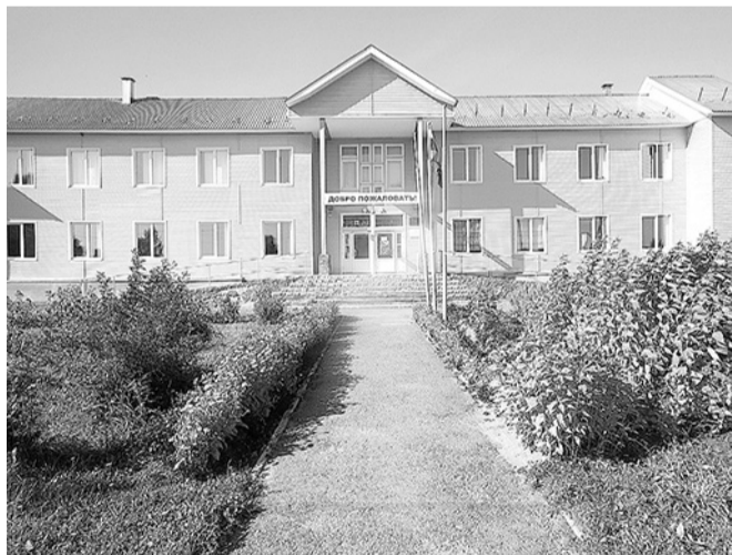
Туровецкая школа.

групп, то есть детсада, как это сделано в Шейбухте и в Игумнице, пожелал всем успехов в новом учебном году.