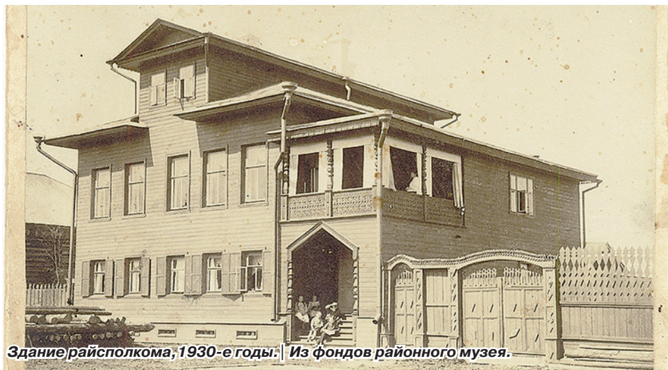
Здание райсполкома, 1930-е годы. | Из фондов районного музея.

Позднее, в 30-60-е годы, проходили различные реформирования. К концу 70-х сложилась экономическая структура района из восьми крупных сельхозпредприятий и леспромпхоза. Административ-